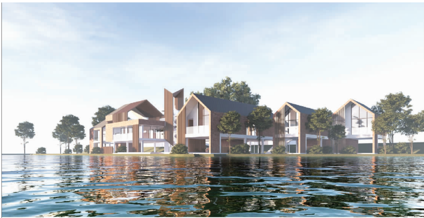
里水理想村项目效果图。

作为里水推动乡村振兴的重要抓手,理想村即使未投用,却已逐步盘活贤鲁岛文旅资源,带动村民转型发展。里水作为南海区连片乡村振兴先行区,正以高端民宿集群的理想村为引领,通过民宿集群、文旅产业推动南北两大乡村振兴精品示范线建设,逐步打造粤港澳大湾区最美岭南水乡。