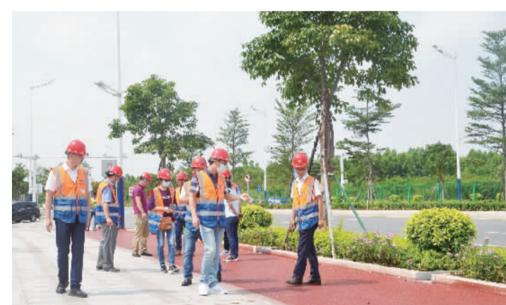
中国二十冶集团有限公司佛山西站一期路网工程项目经理部对项目情况进行检查。

环站东路(站前北路-兴业路)建设工程顺接环站东路、兴业路,与兴业路、招大路形成十