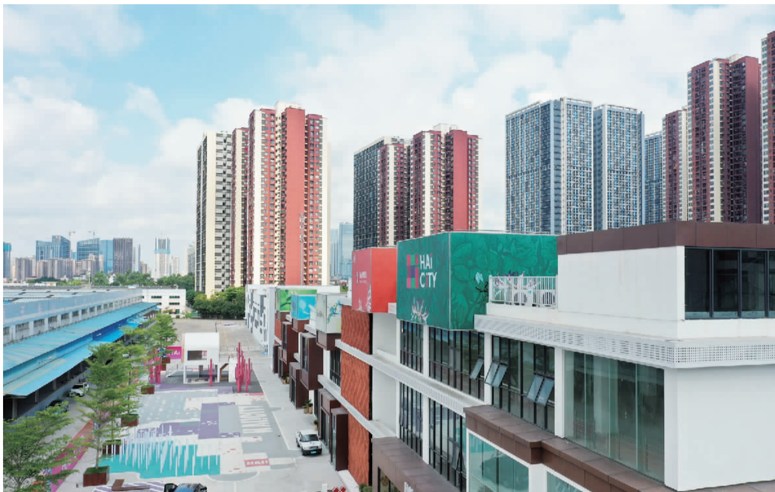
■桂城海逸新经济小镇是“微改造”的示范项目。

“干”字当头,“村改”破局。对南海而言,加速推动村级工业园升级改造,是为了更好地带动城乡高质量融合发展,推动解决城乡融合发展中“城不城,乡不乡”的痛点,更是南海为自己未来谋求突破性出路。