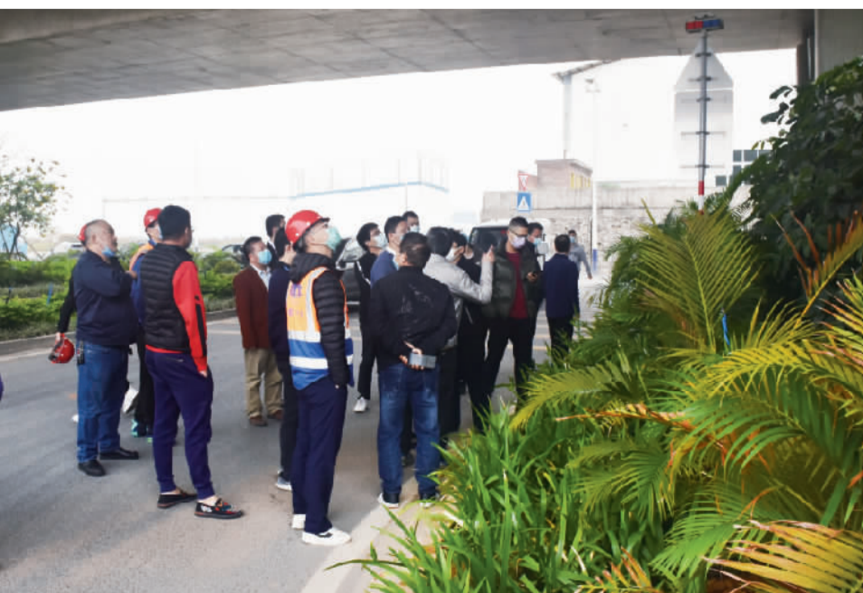
验收组对罗村大道北延线建设工程进行竣工验收。

查、施工等单位对该工程进行竣工验收。在南海区建筑工程质量监督站的监督下,南海区国有资产监督管理局、南海区佛山西站建设管理局、南海区交通运输局、南海区佛山西站城市管理局等部门的见证下,该工程顺利通过竣工验收。