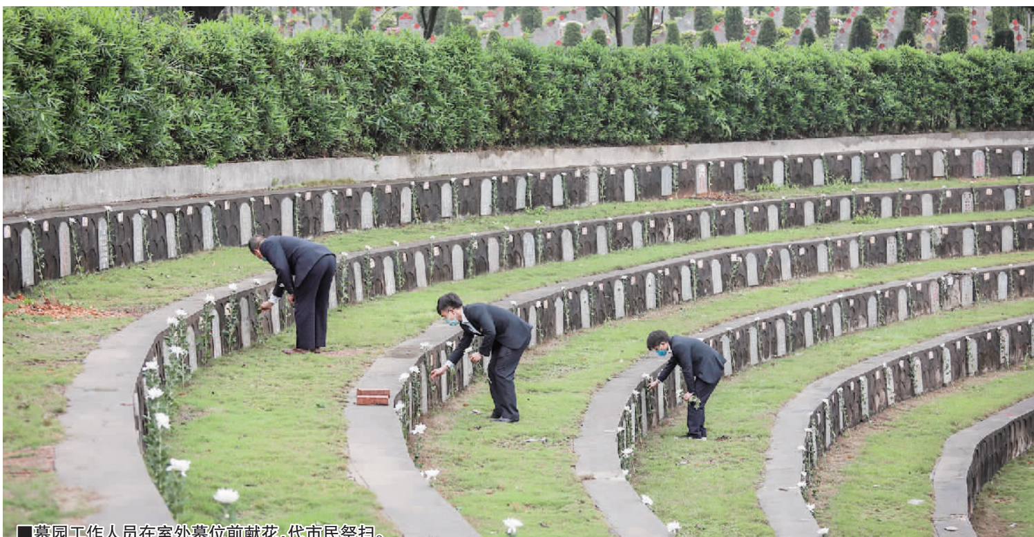
■墓园工作人员在室外墓位前献花，代市民祭扫。