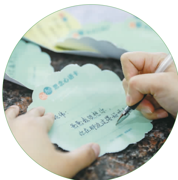
■墓园工作人员把市民的网上寄语写在心语卡上。