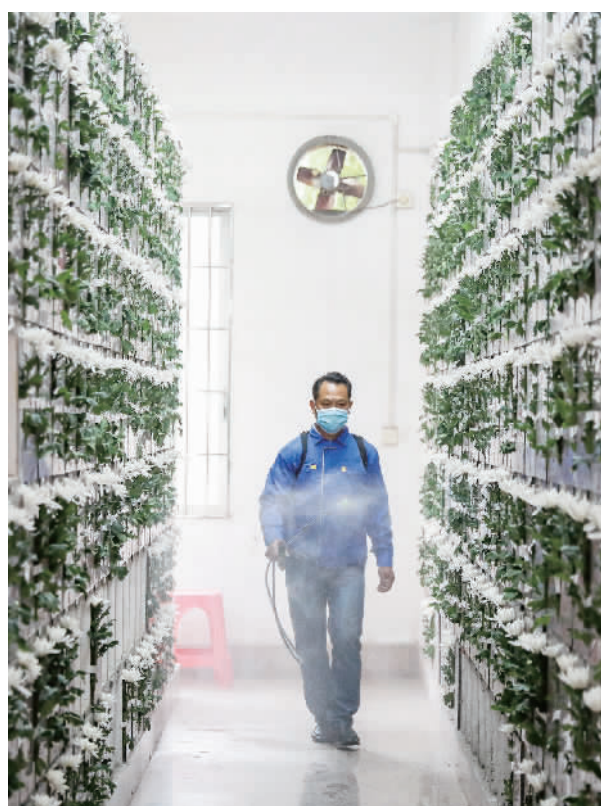
■防疫不放松，墓园工作人员对墓区进行消毒，确保安全。

“几多情，无处说，落花飞絮清明节”。清明在仲春与暮春之交，草长莺飞，大地换了颜色，正是春意渐浓时。