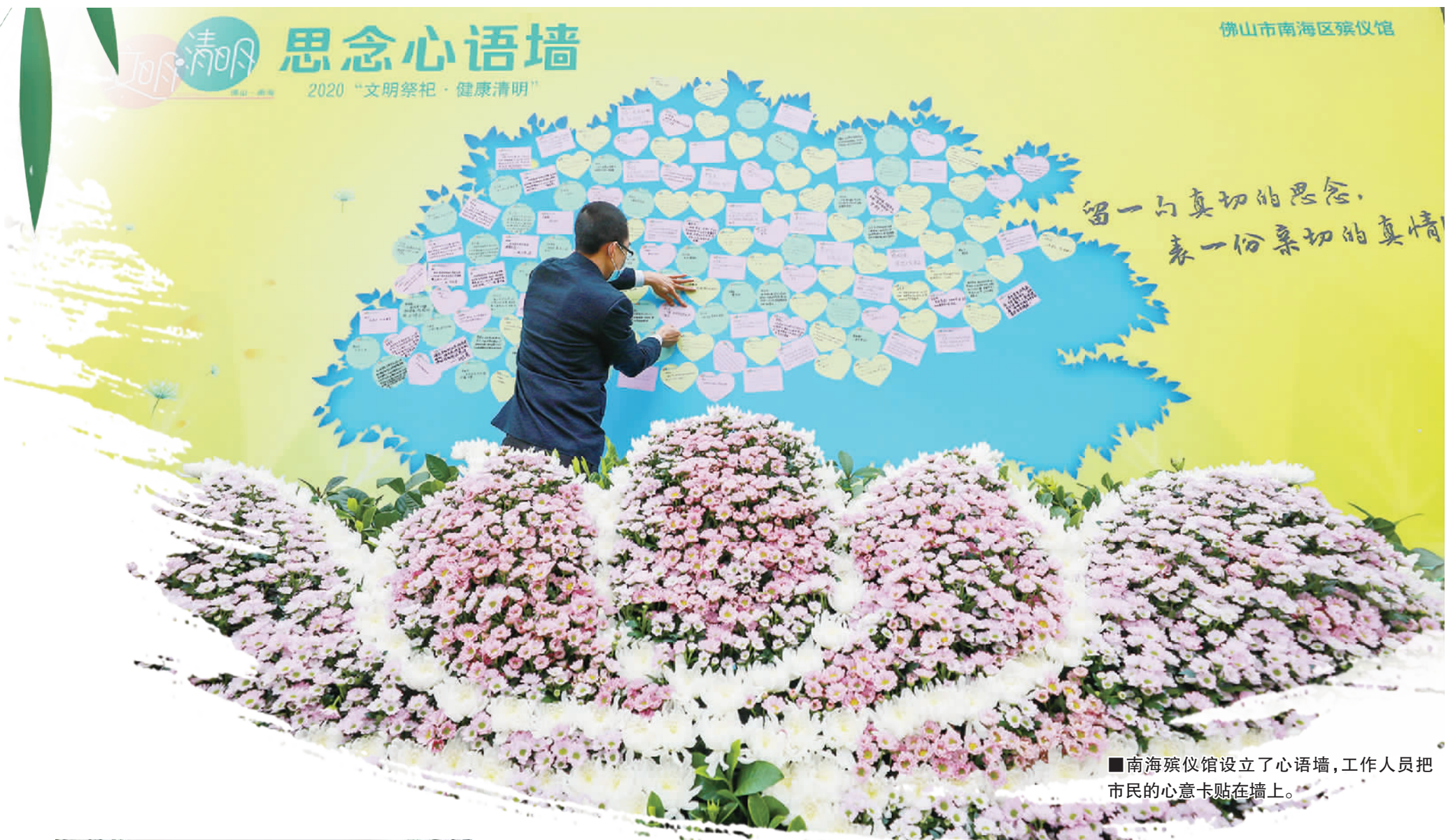
佛山市南海区殡仪馆