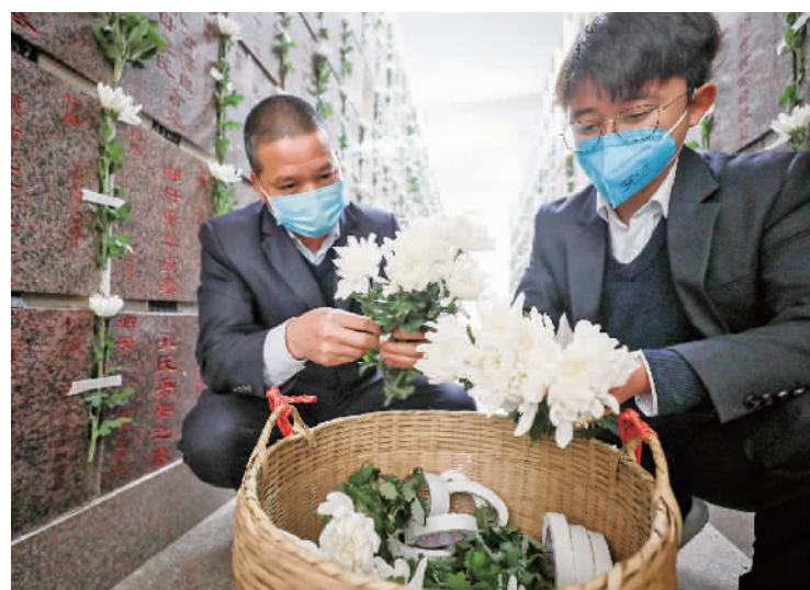
■每朵鲜花都代表一份思念，墓园工作人员在认真整理白菊。