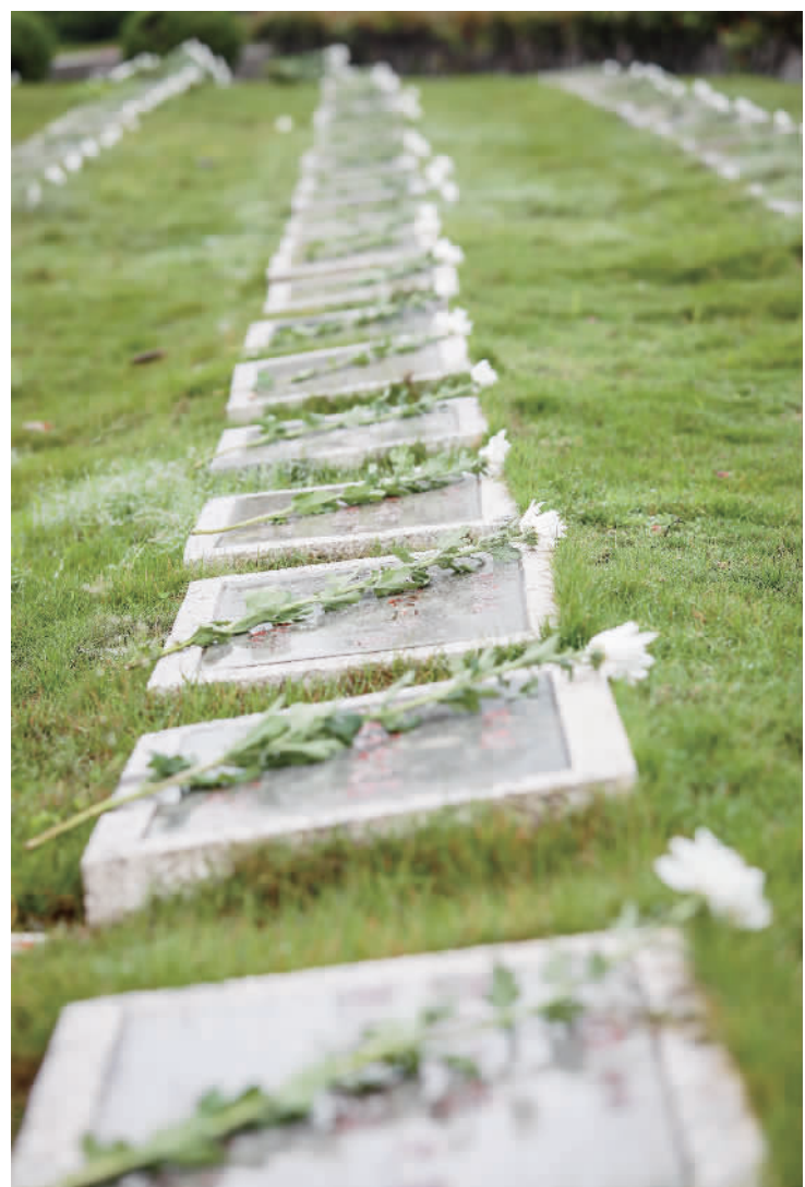
■每一个墓位前面都放着一束白菊。