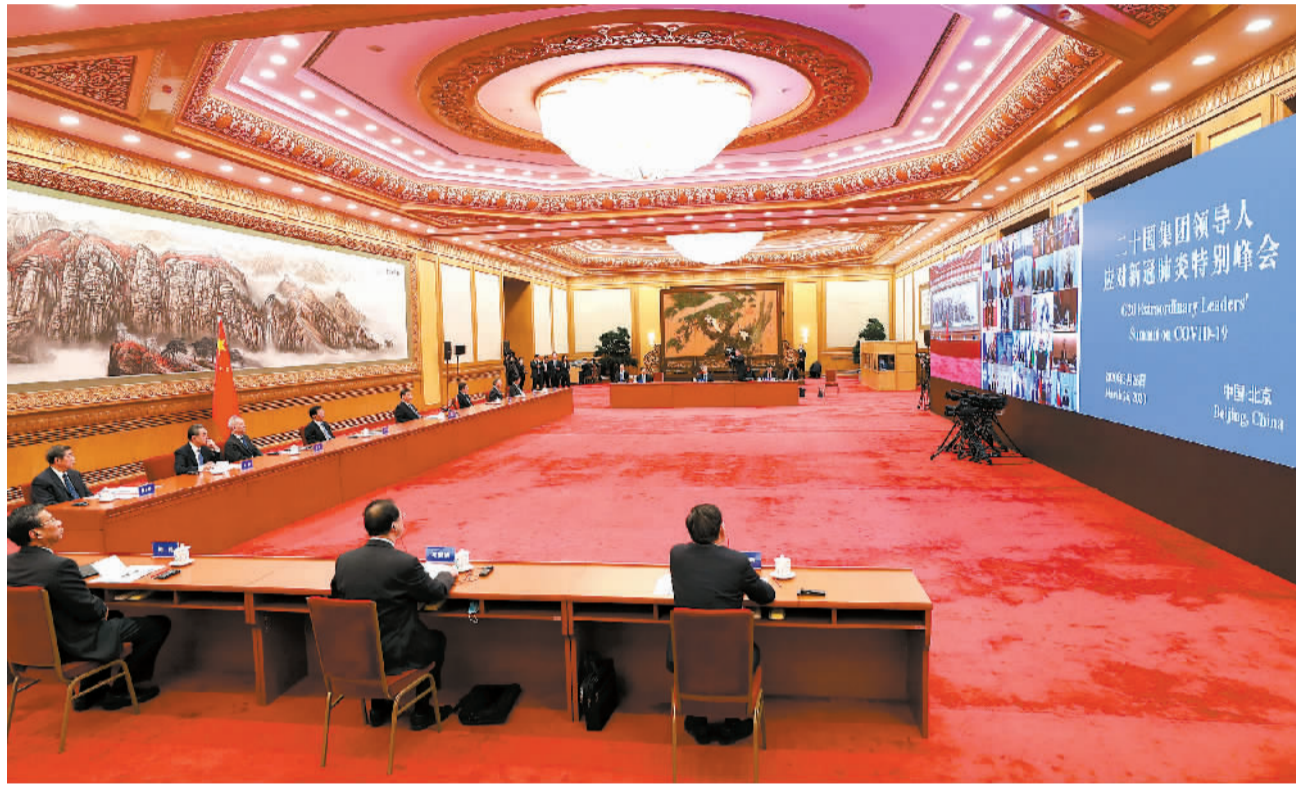
3月26日，国家主席习近平在北京出席二十国集团领导人应对新冠肺炎特别峰会并发表题为《携手抗疫 共克时艰》的重要讲话。