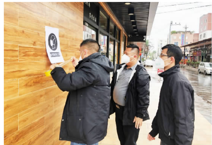
里水胜利社区工作人员张贴疫情防控宣传单。