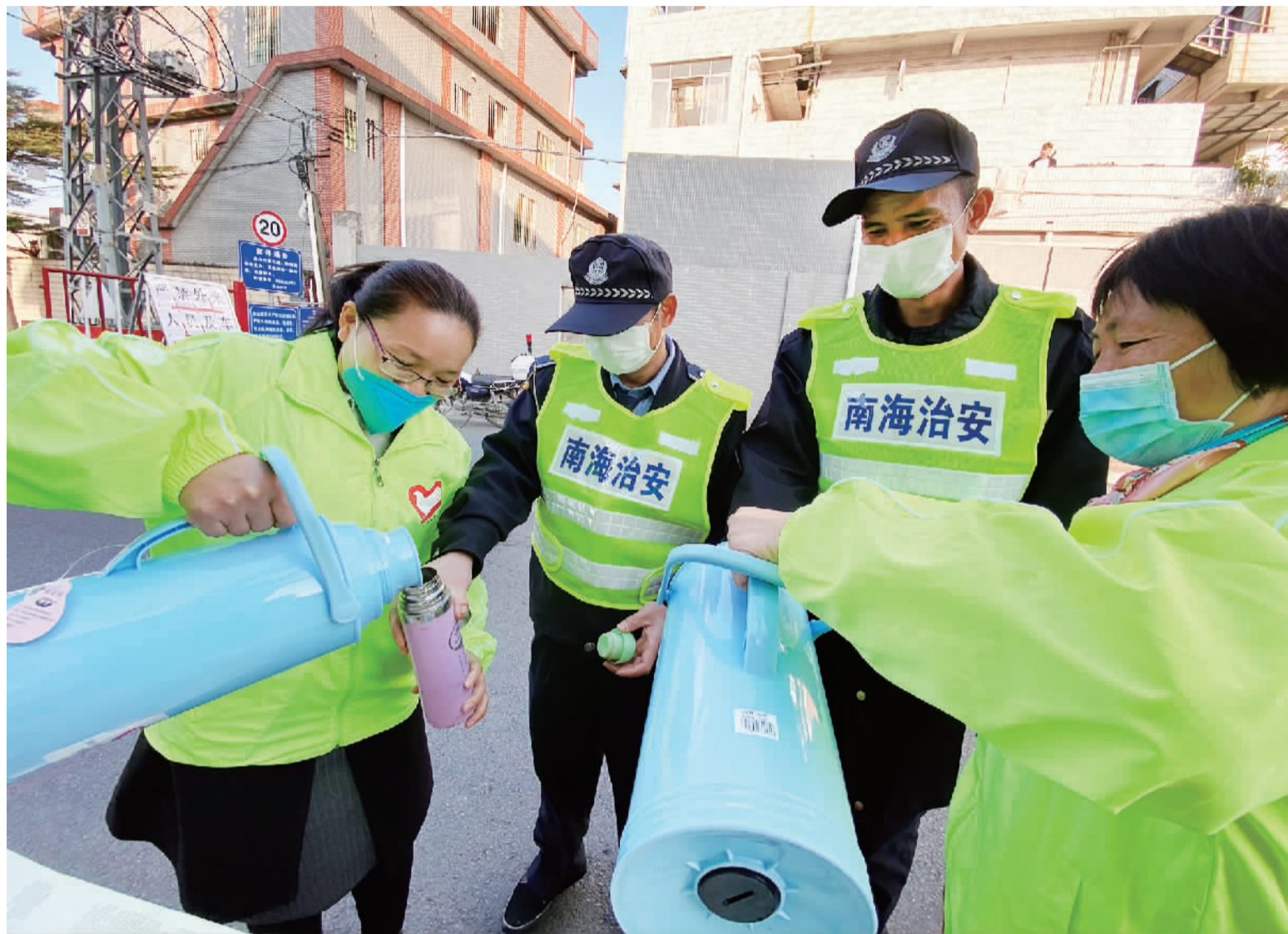
里水综合志愿服务队为治安队员提供热饮。

目前，全镇已设立29个住宅小区临时党支部，党的工作覆盖全部住宅小区；组建党群综合志愿服务队63支，共有2000多人次志愿者投入到全镇党群综合服务中。