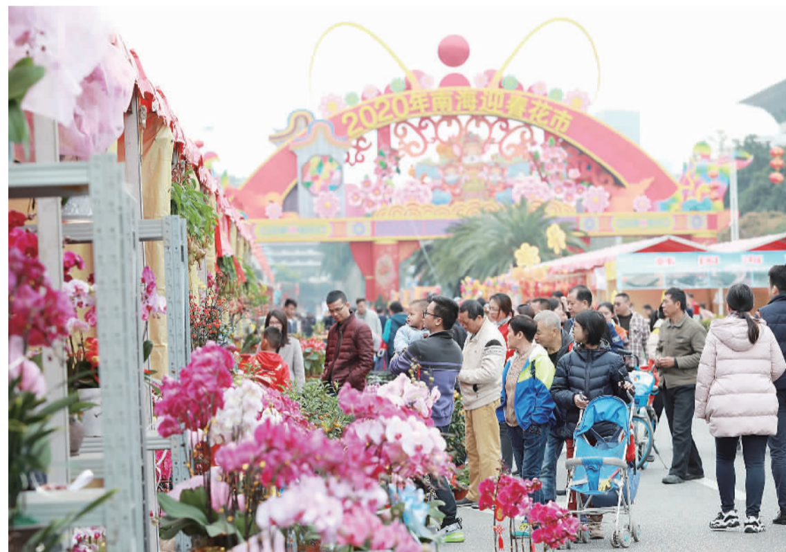
2020年南海迎春花市迎客,市民挑选年花。

桂城街道市政管理处工作人员黄俊程介绍,今年在花市入口处设有1个跨度35米长的“鼠岁报佳音”主牌楼,表达了百花竞放喜迎春的美好祝愿。牌楼采用钢结构主体骨架搭建,外围采用传