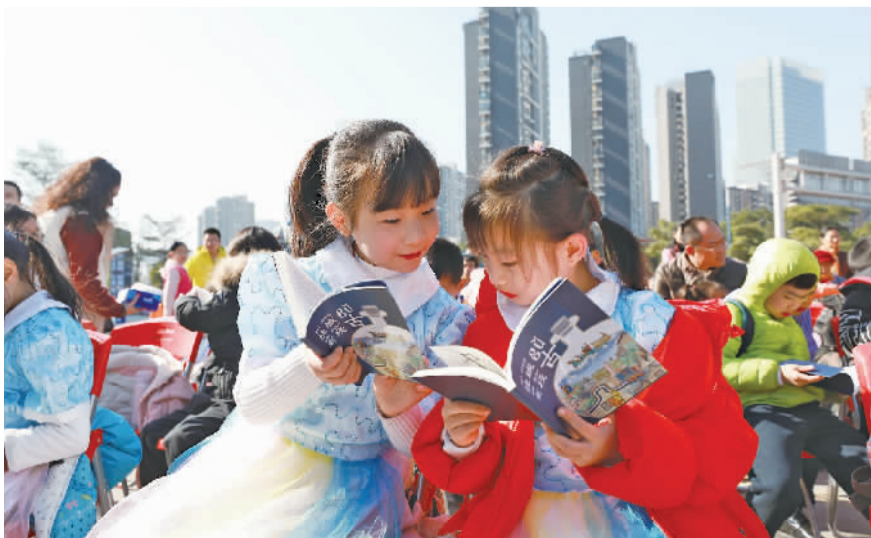
金融城广场读书驿站启用,学生代表们现场阅读《桂城有段古》。

优质的人居环境不仅表现为居住舒适、生活便利,还要有匹配的公共文化服务供给。2019年,南海持续优化公共文化服务,不断满足群众多样化的文化需求,实施文化悦民工程,举办樵山文化节、“渔耕粤韵”文化节等文体活动,社区综合性文化服务中心实现全覆盖,全年共开展群众文艺演出等活动5190场,放映农村公益电影804场,参与人数超216.2万人次。目前,南海已建成1个总馆、7个镇街分馆、181个智慧图书馆的公共阅读网络,新增图书19.29万册,公共文化数字化平台上线运行,公共阅读服务实现全域渗透。市民坦言,如今在南海“住得更舒服,也更有品质。”