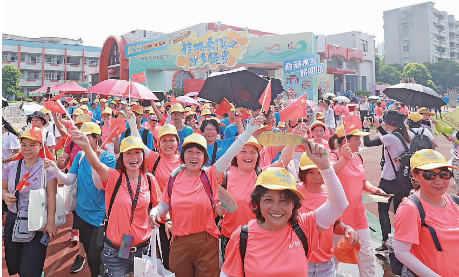
市民参加“游历乡村看振兴”2019桂城叠滘水乡徒步,领略水乡美景。

2020年,南海将继续以“只争朝夕,不负韶华”的战斗姿态书写好新时代有温度的高质量民生答卷,持续提升市民安全感、获得感、幸福感。