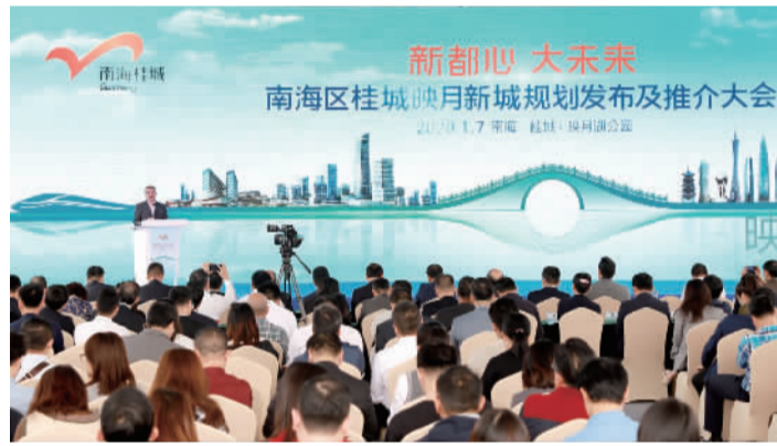
■桂城映月新城规划发布及推介大会现场。

映月新城核心区面积5.38平方公里,作为首期重点发力的核心区,桂城将以映月湖为圆心打通周边水系、路网,推动平洲玉器珠宝特色小镇、平西时尚小镇、海逸新经济小镇等特色小镇建设发展,并布局图书馆、艺术馆、体育场馆、儿童公园、滨水景观带等公共配套和商业水街、国际社区、企业总部,打造一个面向市民、集聚活力与塑造品质的“新都心”,这将成为南海建设广东省城乡融合发展改革创新实验区的生动案例。