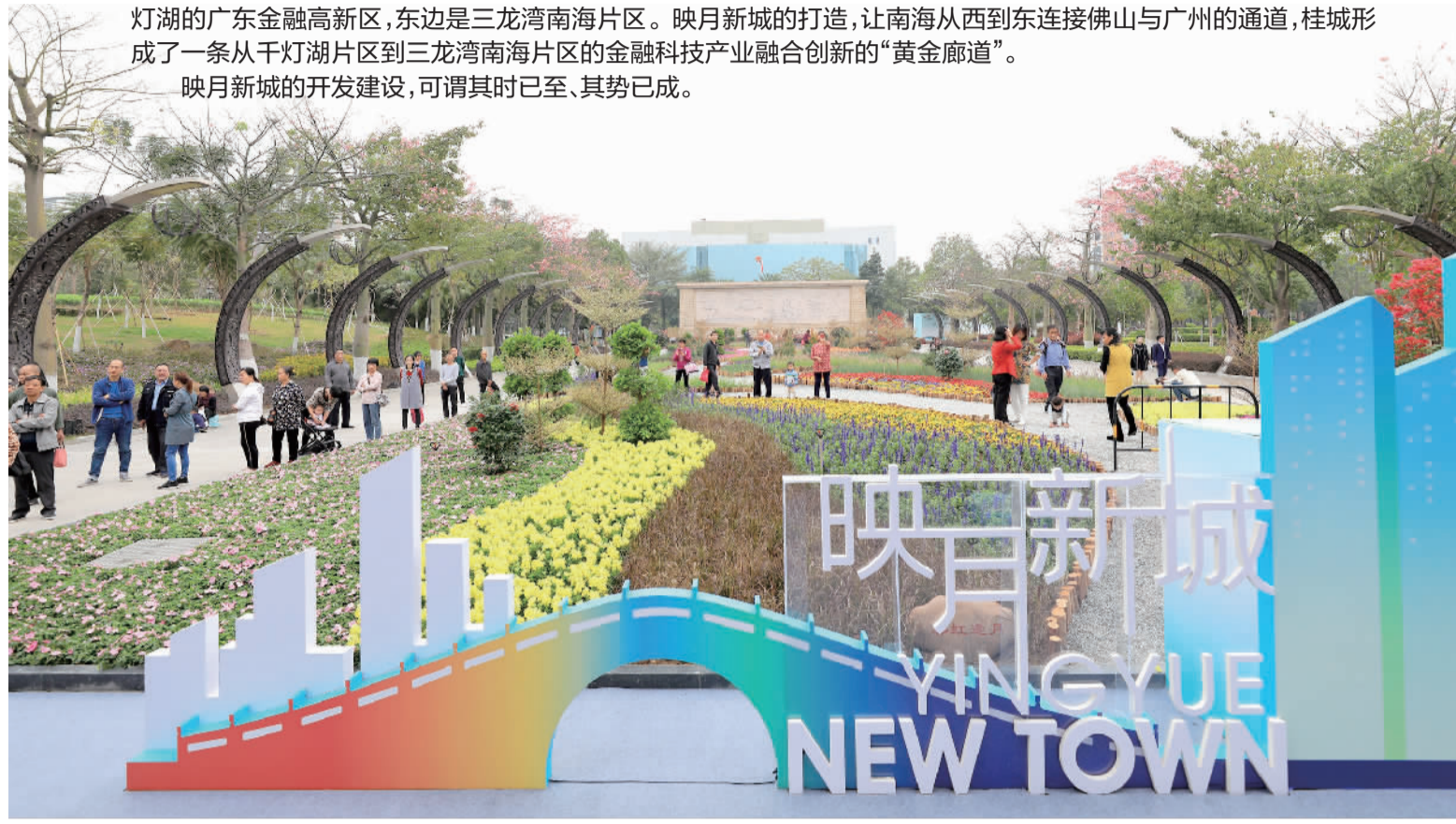
■映月新城将打造成广佛高质量融合发展的创新城区“新都心”和知产转化“加速器”。