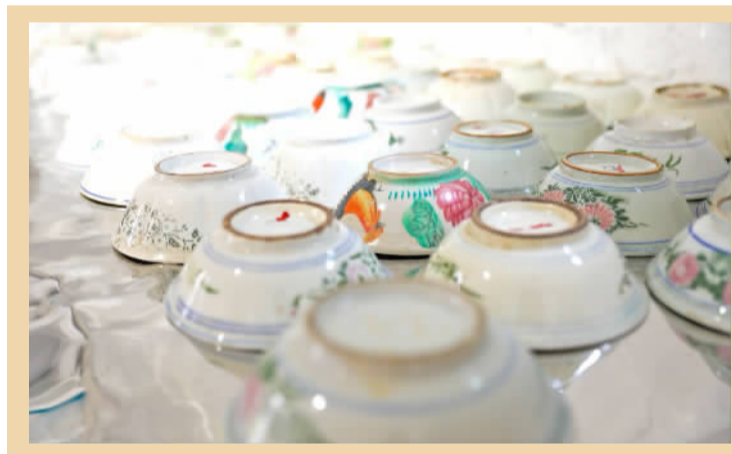
■“艺术盲盒魔法屋”的灶台上,摆满了老瓷碗。