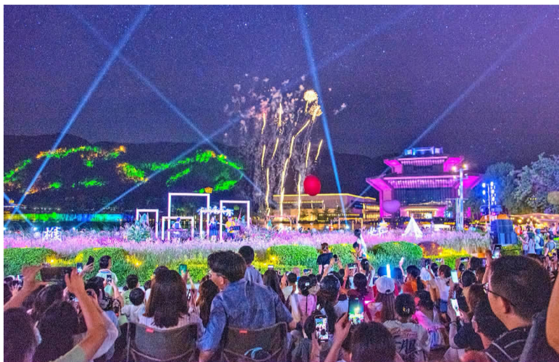
■四季营地、夜经济集市等新潮活动的开展,让西樵的文旅IP更具年轻态,也赢得了市场的良好反响。

创意服务产业、“文旅+”优势产业四大产业提质升级,并实施文旅可持续发展“五个三”行动计划,出台覆盖七大方面的配套政策,全方位、多维度、立体式推动佛山西樵岭南文旅产业集聚区的“愿景图”变为“实景图”。