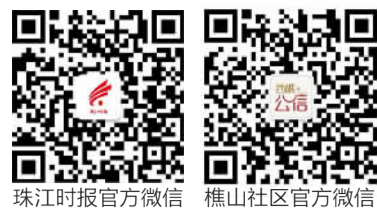
珠江时报官方微信 樵山社区官方微信