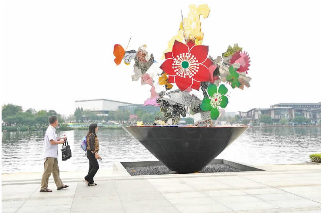
■市民欣赏艺术作品《永恒之花-立花》。