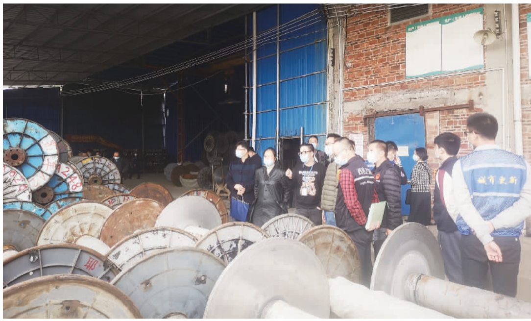
■西樵多部门联合对百西某村级工业园开展联合执法行动。

全域综合整治的总体布局,严格把握时间节点,构建城乡空间新格局。具体将从“全力推进低效建设用地腾退、全力加快连片产业用地储备、全力守好‘三条’红