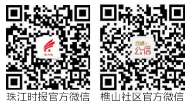
珠江时报官方微信 樵山社区官方微信