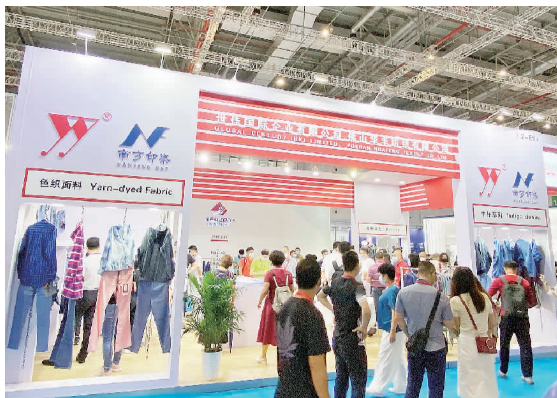
南海纺企以“西樵面料”品牌亮相展会。

今年已是南海区纺织行业协会组织抱团参加该展会的第20年,本次参展的南海纺企包括德耀、立笙、华丰、名杰等12家企业。展会中,南海纺企以“西樵面料”集体商标形象示人,以“流行、时尚、品质、低碳”