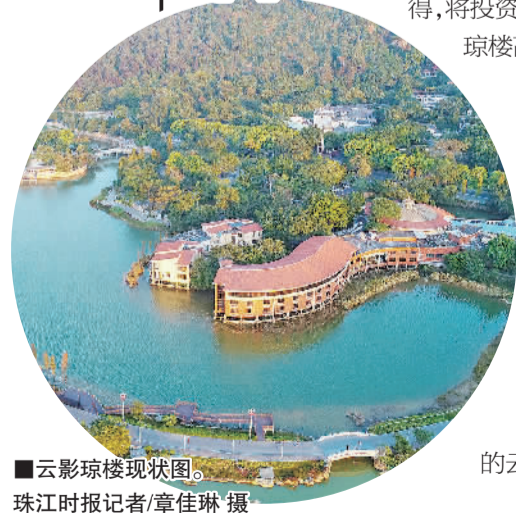
■云影琼楼现状图。

下阶段,西樵镇将继续突出重点,加强密闭通风不良场所监督检查和宣传引导,切实做到外防输入、内防反弹,毫不放松抓紧抓实抓细疫情防控常态化工作。