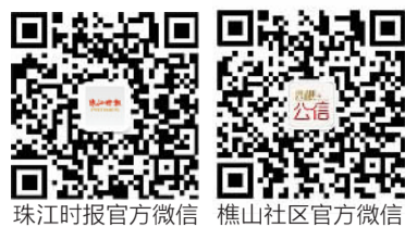
珠江时报官方微信 樵山社区官方微信