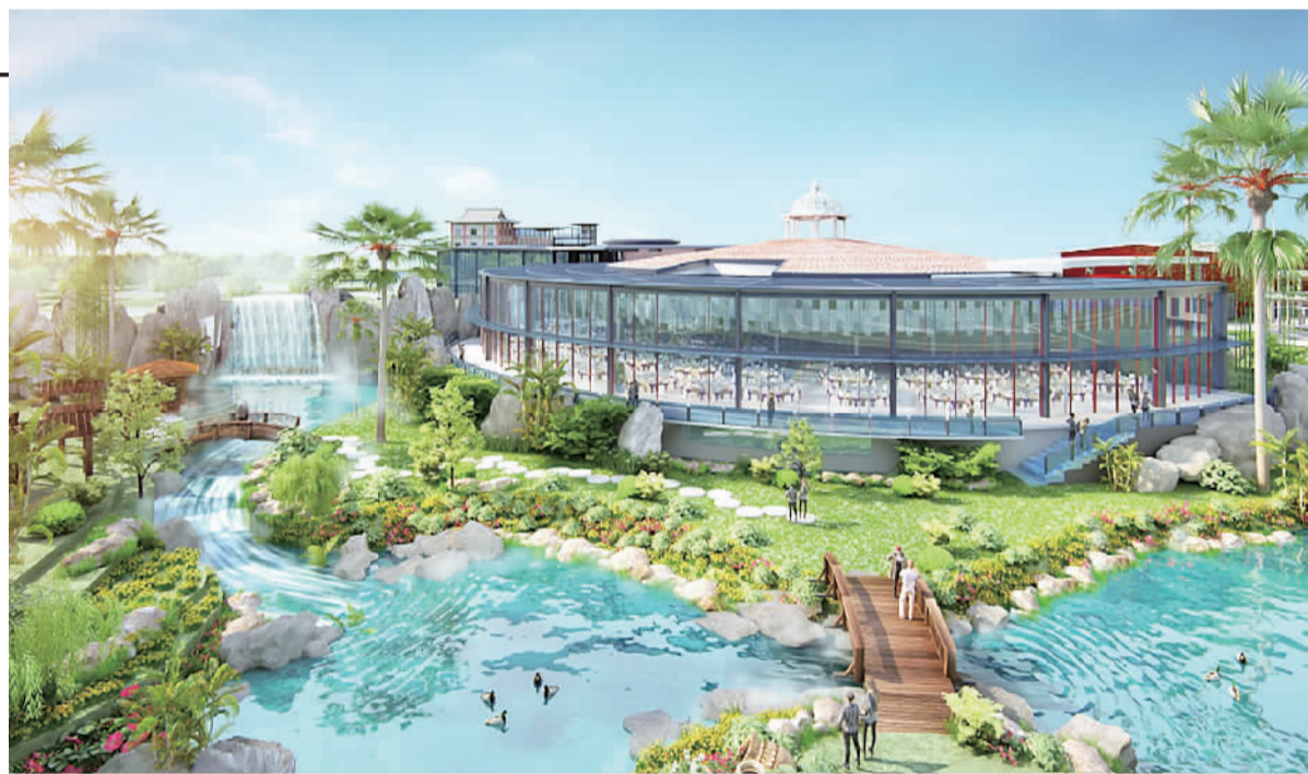
■云影琼楼高端休闲度假酒店项目效果图。

珠江时报讯(记者/钟泽诗 通讯员/关蕴琪)西樵老牌酒店云影琼楼将换新装!5月29日,西樵听音湖片区樵园东路云影琼楼和白云楼地块网拍成交,该地块由佛山市南海通创有限公司竞得,将投资至少1.2亿元打造云影琼楼高端休闲度假酒店。