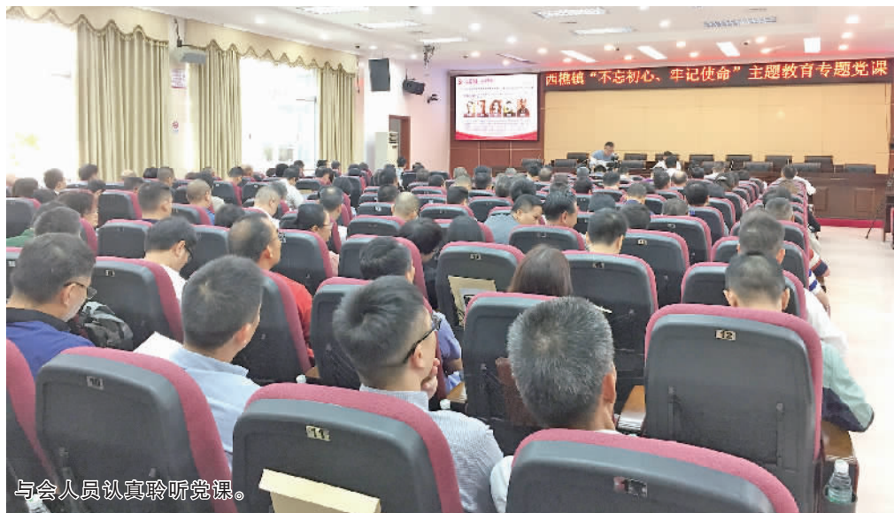
与会认真聆听党课。

涵,始终如一、担好使命,从上级重要指示批示精神中为初心和使命找到最根本的时代落点,深学细照、把牢方向,在发扬自我革命精神中永葆政治本色,“把握机遇、切实惠民”,在砥砺前行中书写新时代高质量发展新西樵奋斗答卷。