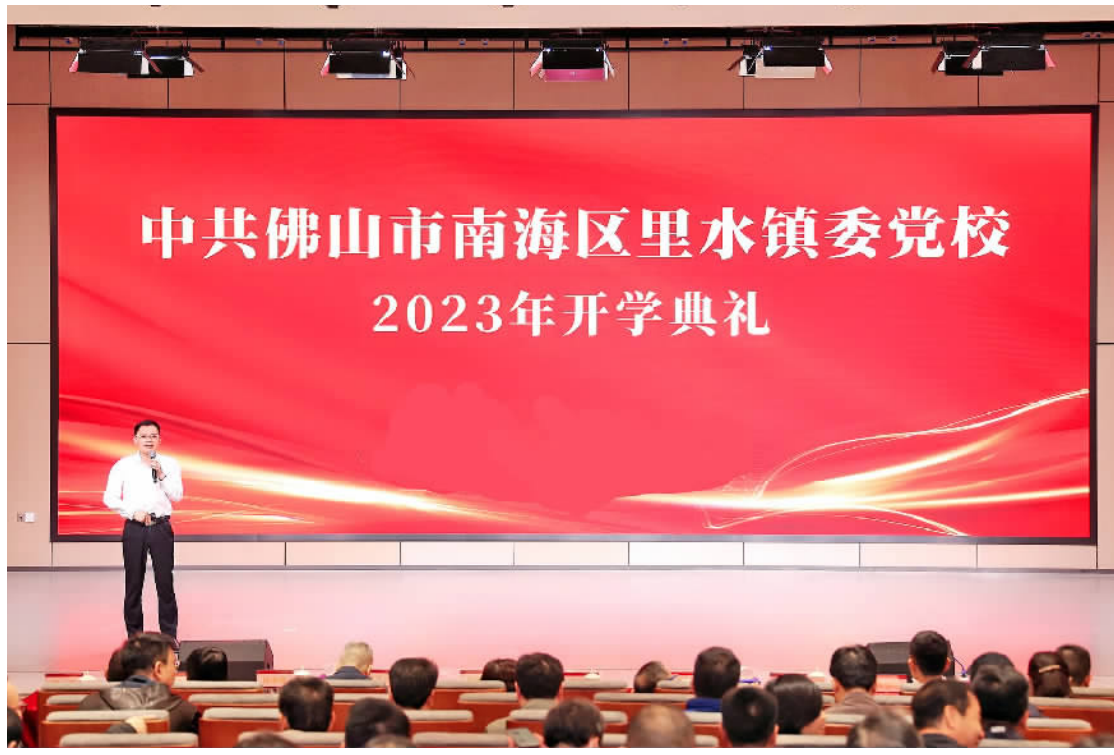
里水镇委党校开讲新年第一课。

推动经济高质量发展，关键在党，关键在人。自2月3日里水召开全面改革创新暨经济高质量发展十大行动推进大会后，各项工作迅速部署落实。2月7日，里水镇委党校举行2023年开学典礼暨“贯彻新发展理念 实现高质量发展”专题联合培训班，不仅以新年第一课吹响了发展号角，更是落实镇委聚焦“全力打造贯彻新发展理念的镇域样本”目标的重要举措。