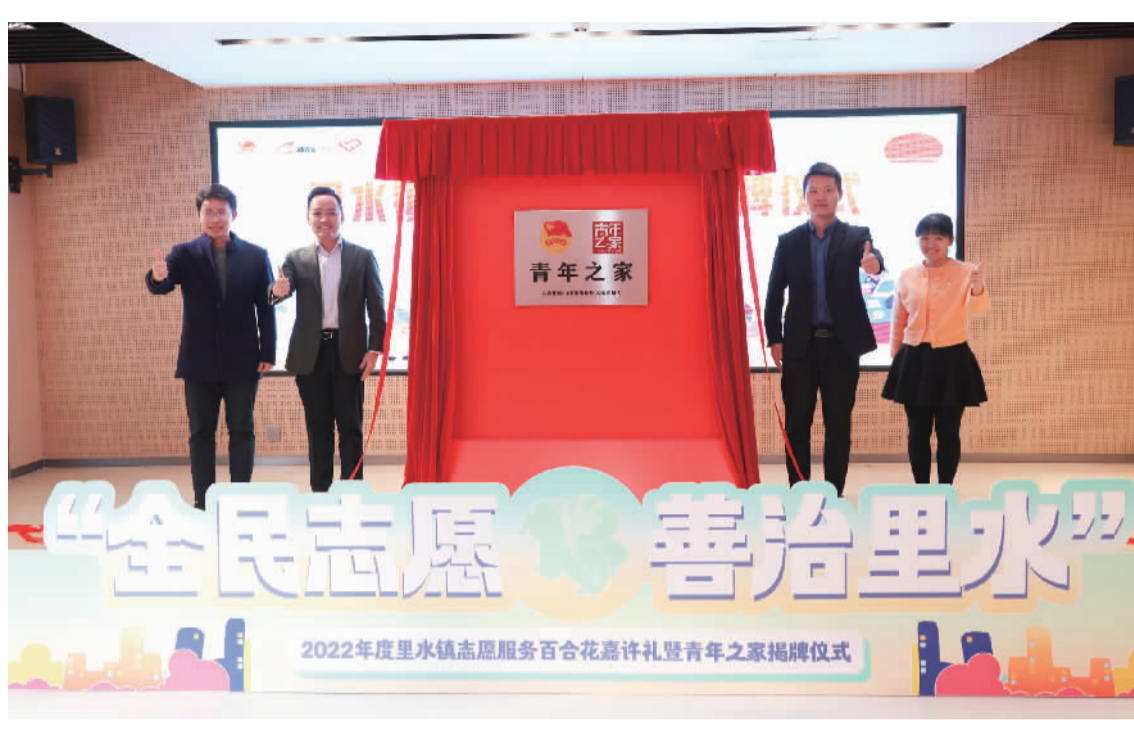
里水镇“青年之家”揭牌。

珠江时报讯(见习记者/何海燕 通讯员/李卓泓 罗蔼彤 摄影报道)日前,里水镇举行“全民志愿·善治里水”2022年度志愿服务百合花奖嘉许礼暨“青年之家”揭牌仪式,表彰148位先进志愿者和20个优秀团队,激励更多市民参与志愿服务。