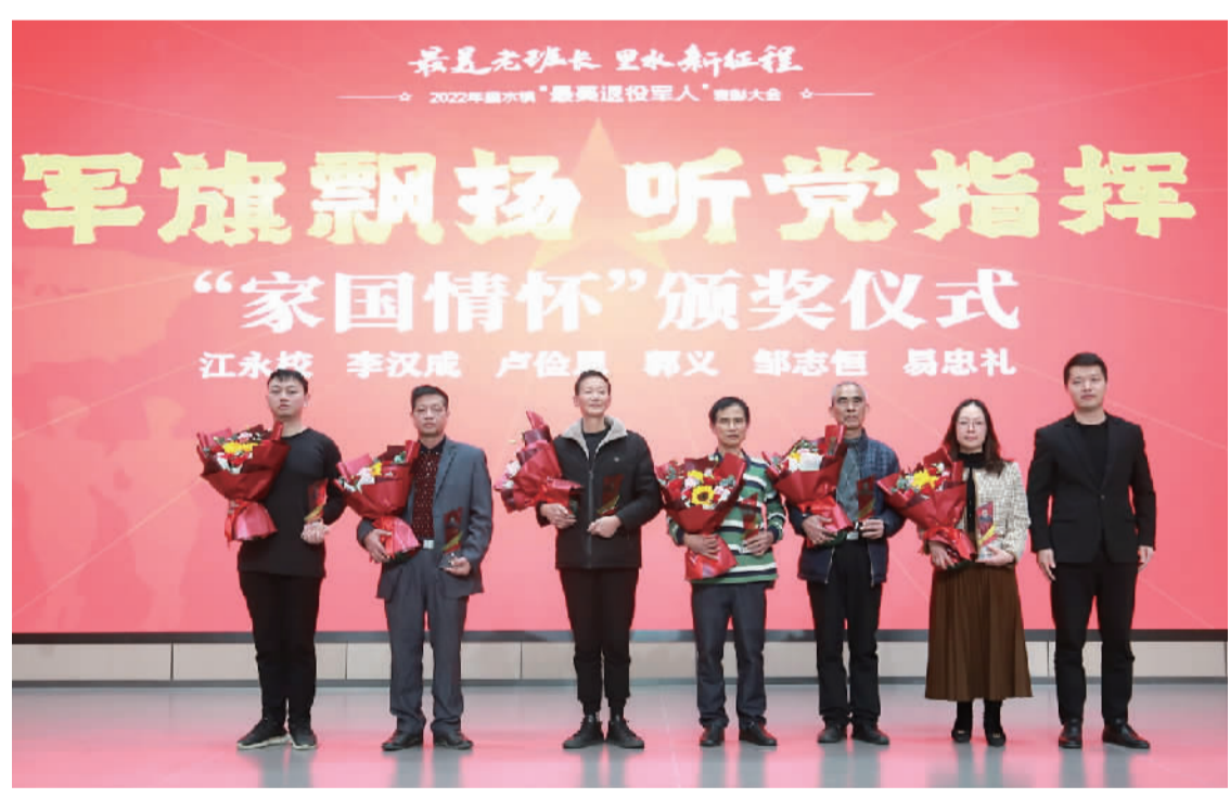
最美退役军人上台接受表彰。

作为“里水突击队”的重要核心力量,多名退役军人表态要为建设“梦里水乡 湾区名镇”作贡献。现场,里水镇副镇长杜坤向退役军人代表授予“里水突击队老班长支队”队旗。