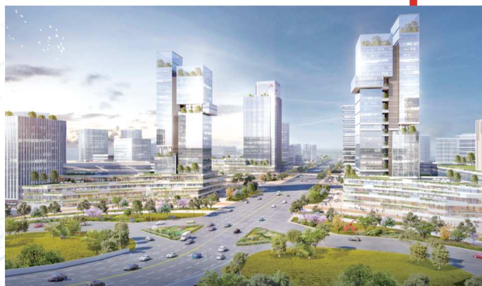
■南海电子信息产业园效果图。

非凡十年,里水创下全国综合实力千强镇前十的耀眼成绩单。展翅腾飞的里水,将抢抓广佛全域同城等机遇,主动出击、大胆求变,开拓全新产业空间,攀“高”逐“新”聚集更多高端产业、高端人才,支撑“不在广州,就在广州”的城市新梦想。