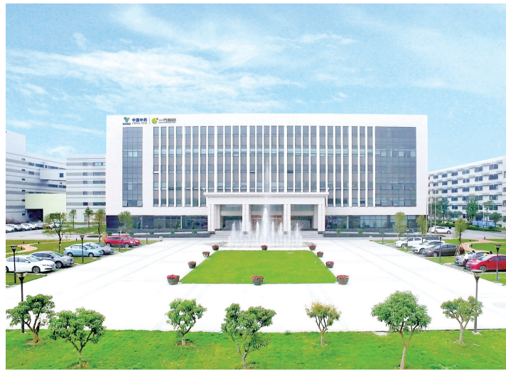
■位于中国中药(健康)产业园的广东一方制药有限公司。

里水镇党委书记黄伟明表示,里水将重点培育涵盖研发设计、生产智造、高端服务于一体的全产业链的电子产业集群生态;重点打造展旗山片区一中医药产业基地以及里湖新城一健康硅谷;以“广东新材料产业基地”为载体,以中山大学广东新材料产业基地联合研究中心、佛山中国发明成果转化研究院推动新材料产业发展。力争“十四五”期间成为南海充满活力的、新的经济增长极。