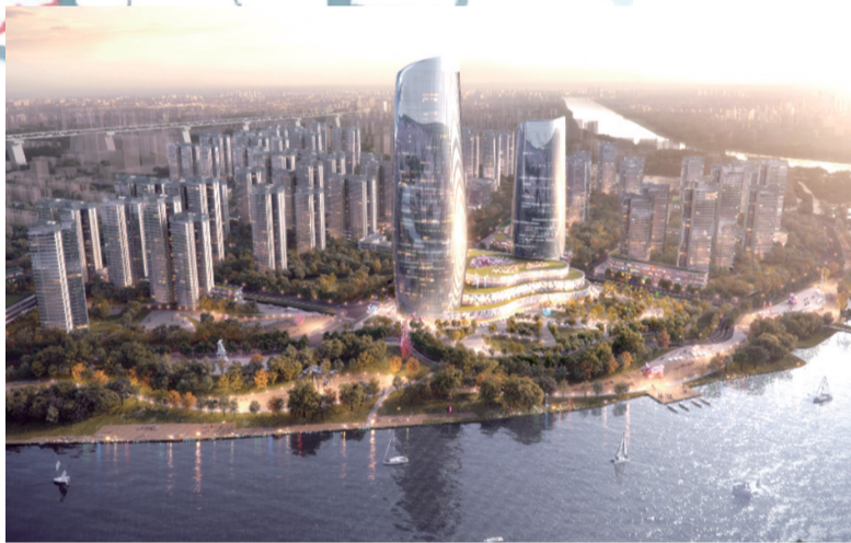
■位于里水新中心城区的东部工业园连片改造提升项目效果图。