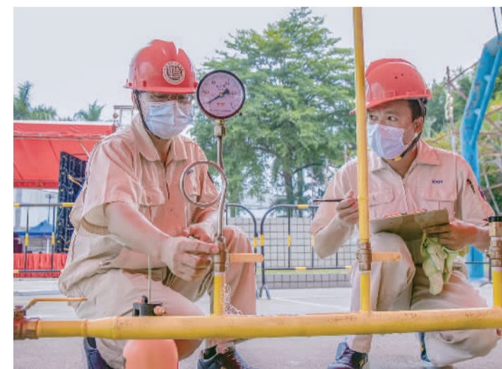
参赛职工对管道进行检测。

同时,田源希望各企业工会持续加强人才政策宣传,广泛深入开展技能竞赛、岗位练兵等活动,为一线技术技能人才搭建展示平台,共同合力造就一支高层次、高素质、高技能人才队伍,推动全镇技术水平再上新台阶,为南海高质量发展赋能。