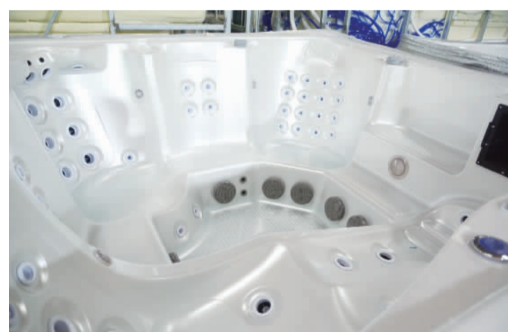
广东水晶岛智能健康股份有限公司生产的按摩浴缸。

高质量发展的领头羊,里水正坚持创新驱动发展战略,通过强化科技创新引领力、培育上市标杆企业、打造新兴产业集群等方向入手,引领制造业企业转型升级。