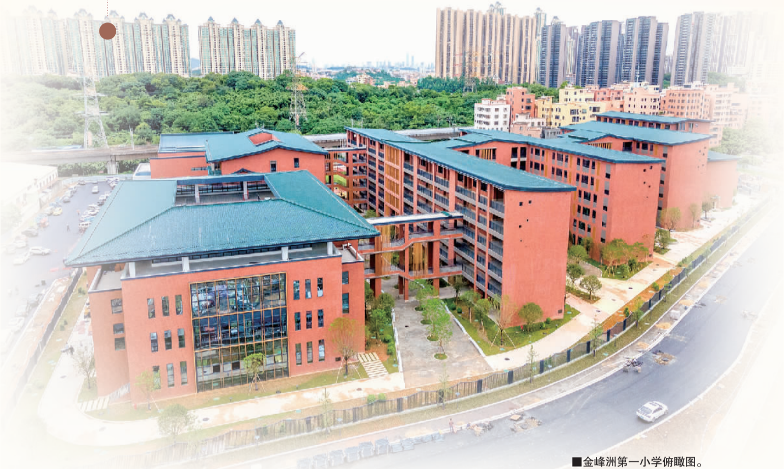
■金峰洲第一小学俯瞰图。