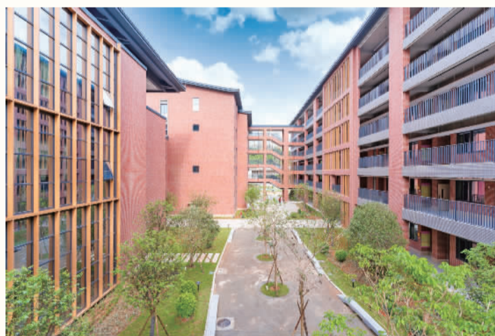
■校园空间错落有致。

校内各类功能场室一应俱全，为培养孩子们的兴趣爱好、让孩子拥有获得幸福的素质教育提供了良好的硬件设施。例如，室内体育馆采光效果好，保障体育课不会受天气的影响，让学生有充足的运动空间；电脑室“高大上”，能保障学生享受现代教育技术。书法室、象棋室、美术室、音乐室，为学生创造浓厚的文化艺术氛围。为避免校园周边噪声影响，金峰洲第一小学建设还做了相应的防噪措施，如动静分区、功能场室安装吸音板、所有场室使用隔音玻璃等，保障学生的学习和生活质量。