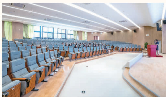
■舒适优雅的报告厅。