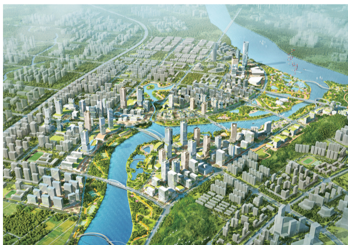
■广佛青创城建设效果图。

接下来,里水的一产重点打造一批超千亩现代农业示范项目;二产提升南海电子信息产业园等特色园区建设;三产推动里水河夜游、贤鲁岛高端民宿等项目建设。还将深化广佛青创城方案设计,积蓄连片势能,全力打造广佛同城背景下“不在广州,就是广州”高质量产城融合示范片区。加快沉香大桥、碧江大桥、南海区有轨电车(里水)示范段等项目建设,巩固28条城乡黑臭水体治理成效,年内完成300个智慧安防区建设,8000套“门禁视频”终端安装,完成7个老旧小区改造和7个市场升级改造工作。加快8个新改扩建学校项目建设,确保9月顺利开学。