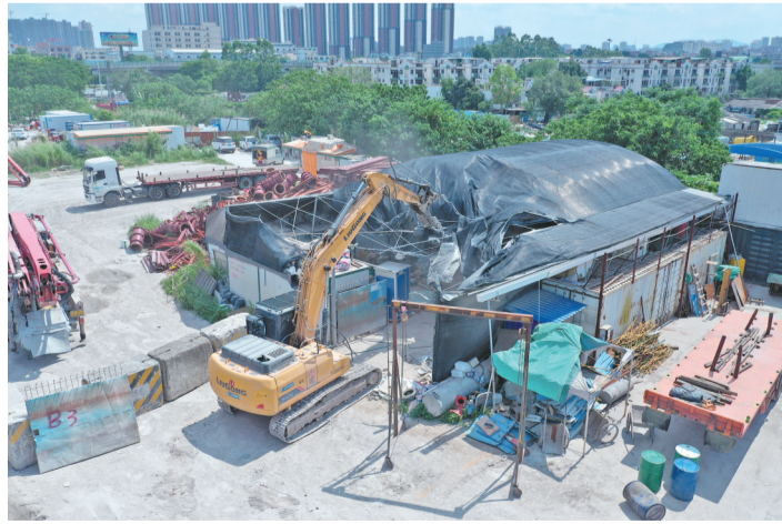
■里水开展全域土地综合整治。