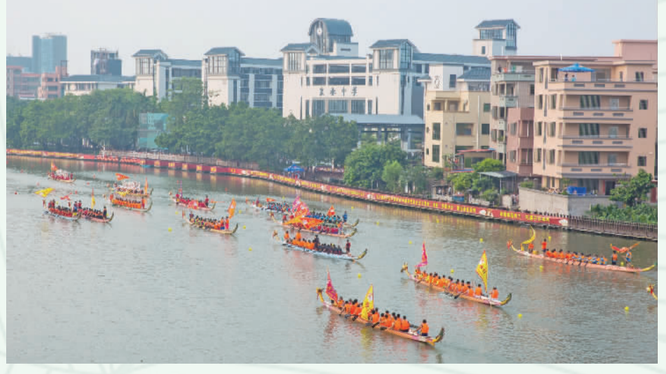
►《群舟竞渡， 壮我中华》。 作者：关绮桃