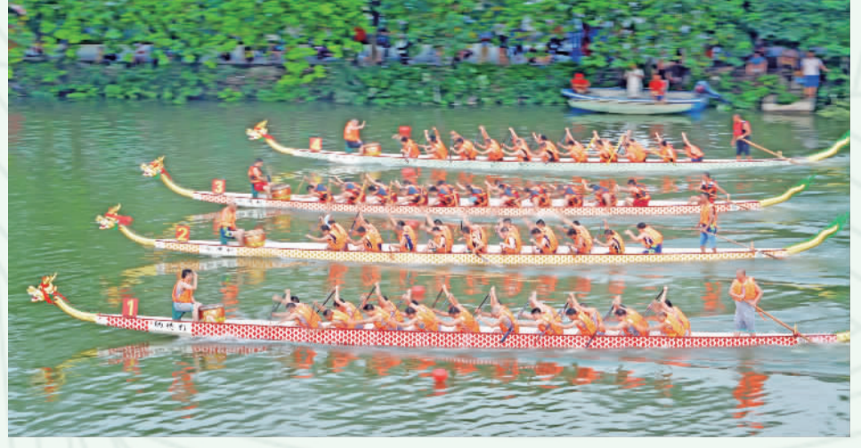
►《龙争虎斗》。 作者：卢展途