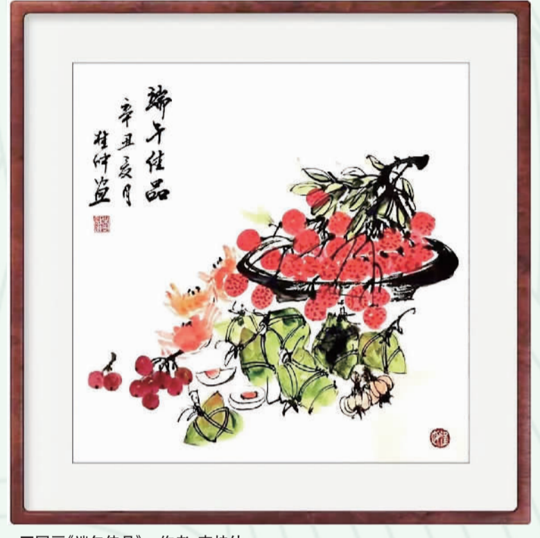
■国画《端午佳品》。作者：李桂恒