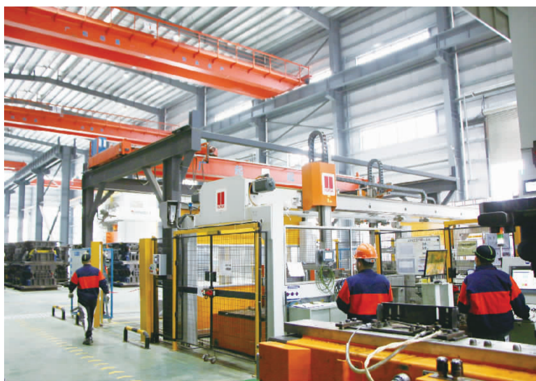
不到一分钟,2500T设备就能生产出一件汽车配件。

据悉,佛山市德展精工集团有限公司(以下简称“集团”)成立于2005年,是一家从事钣金件、五金件的研发、生产与销售的制造商,拥有佛山市德展精密科技有限公司