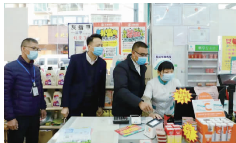
检查组对药店信息采集工作提出指导建议。

里水镇市场监督管理所相关负责人表示,接下来,里水将严格落实疫情防控工作责任,织密织牢市场防疫网,引导企业清醒认识疫情防控的重要性,增强整体防控意识,对食品安全、疫情防控违规行为实行最严处罚,坚持最严问责,共同筑牢疫情防控的“铜墙铁壁”。