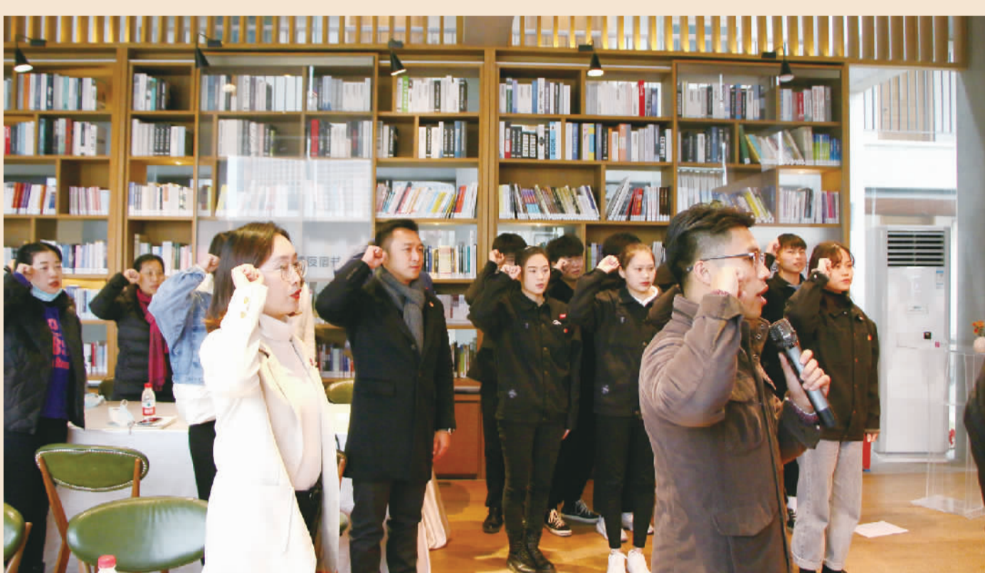
参与仪式的领导、嘉宾、团员对着团徽宣誓。

珠江时报讯(记者/刘伟鹏 通讯员/朱嘉泳 摄影报道)1月8日,佛山什间艺术文化有限公司(以下简称什间)新时代文明实践点授牌暨团支部成立仪式在里水什间举行。