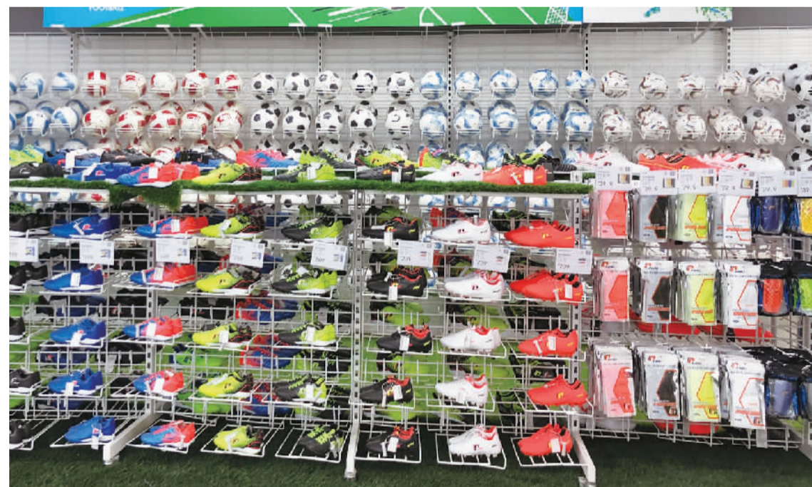
■足球类的产品很齐全。

导嘉宾为舞狮点睛。点睛之后两狮头相碰,随即向两侧分开,印有“马到成功,大展宏图”的彩带从狮嘴处慢慢拉开,呈现在现场嘉宾和观众面前。