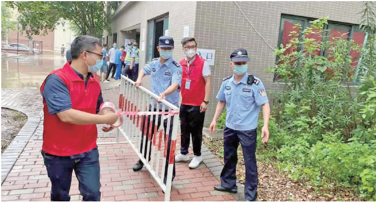
民警与志愿者一起摆放铁马，维护现场秩序。