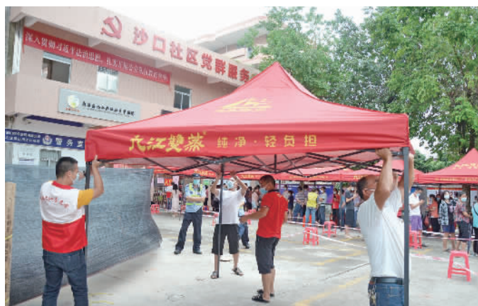
志愿者在沙口社区搭建帐篷。

与此同时，驻点直联团队、分片指导组、后勤保障组等工作组也积极协助村（居）开展核酸检测、信息登记、现场引导、维持秩序、心理疏导、搬运物资等工作，把初心写在行动上，把使命落在岗位上，以守土尽责的担当深刻诠释着党员的初心使命。