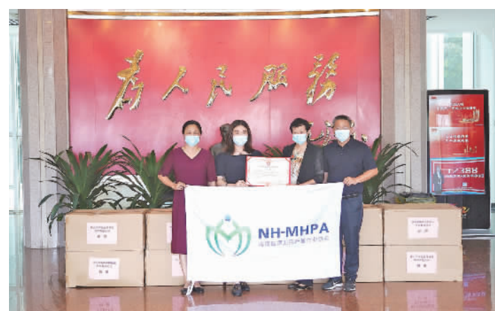
必得福无纺布有限公司捐赠防疫物资。