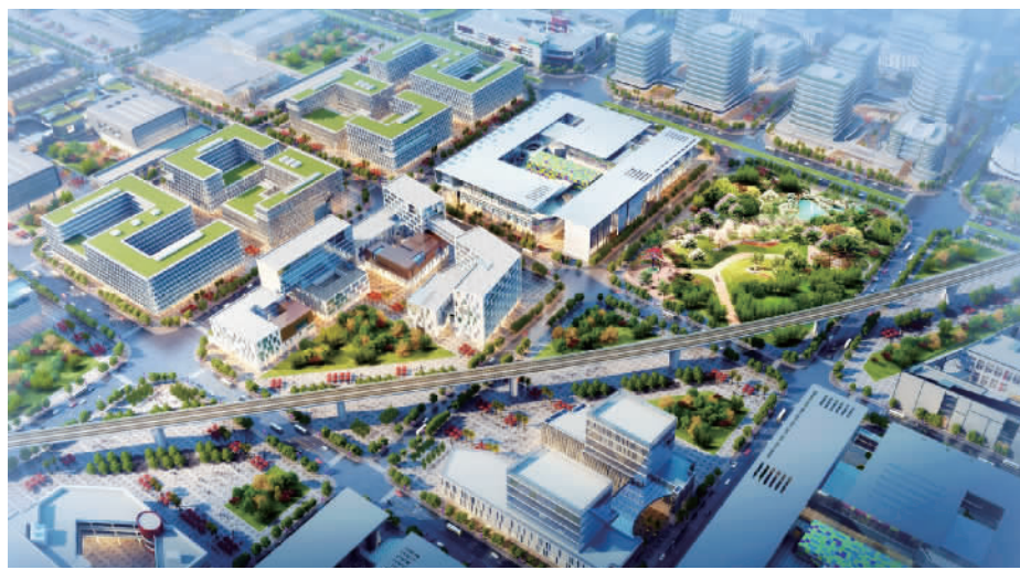
九江加快推进滨江片区的建设,形成临港国际产业社区为核心驱动、以城带乡的发展新格局。图为临港国际产业社区效果图。