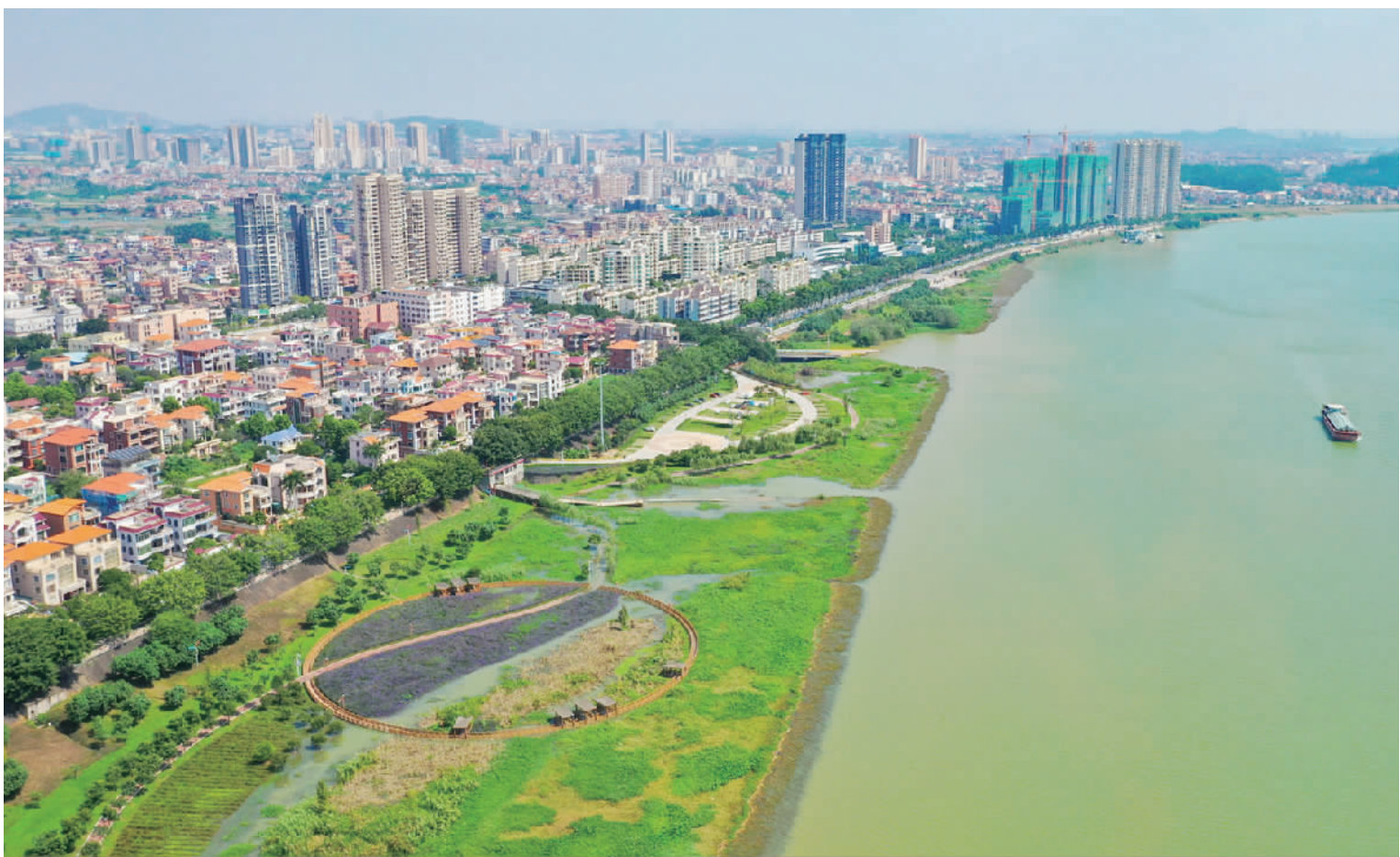
九江积极探索乡村振兴、城乡融合的试点经验,力争为全区提供“九江方案”。图为九江外滩。

从昔日的“鱼米之乡”,到后来发展工业,城市崛起过程中,九江变化的是产城风貌,不变的是乡村的根与魂。2020年,九江更是以打造南海区城乡融合发展先行区为目标,坚持党建引领,积极探索乡村振兴、城乡融合的试点经验,力争为全区提供“九江方案”。