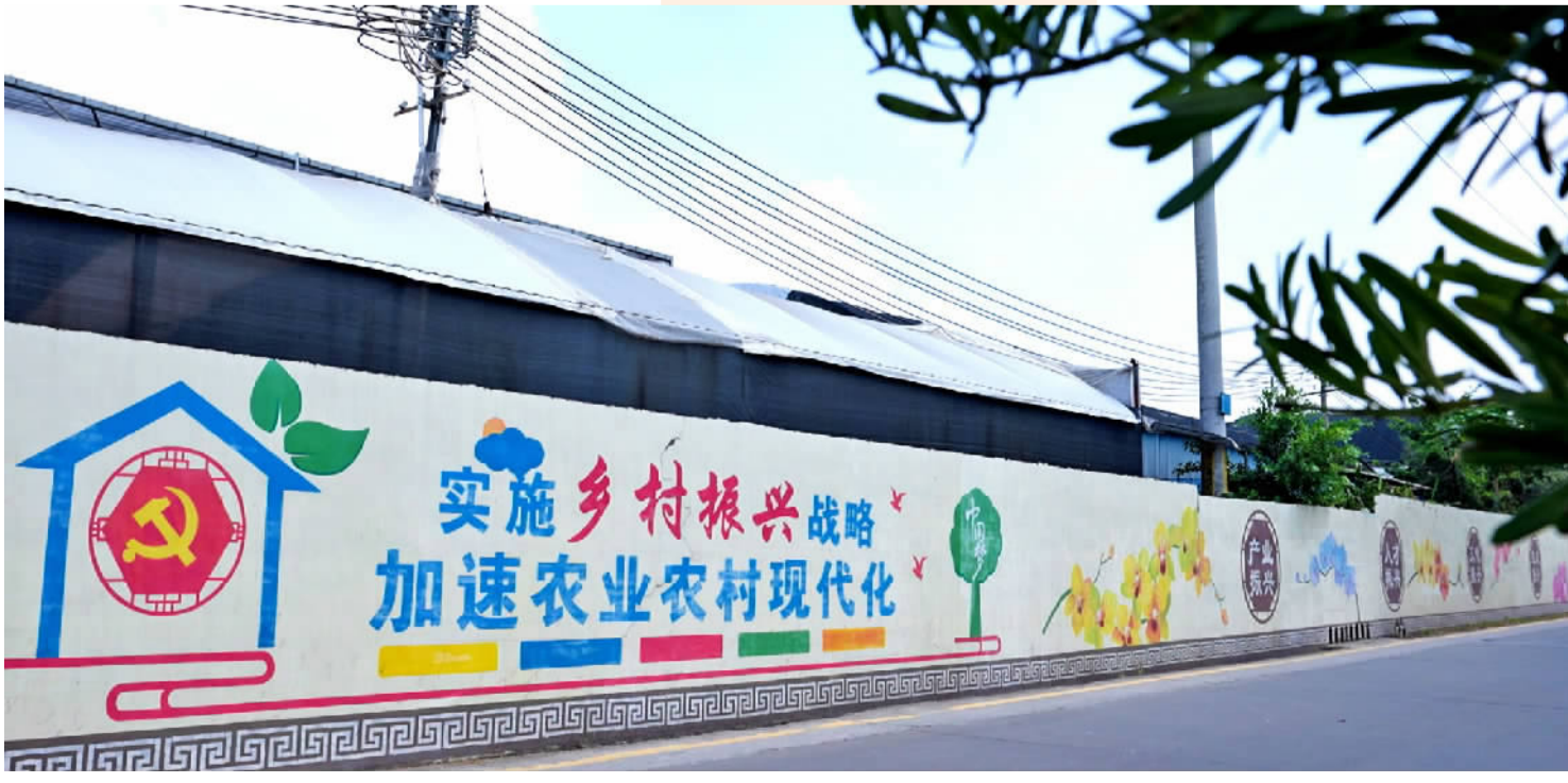
■平胜社区内的涂鸦长廊。(资料图片)