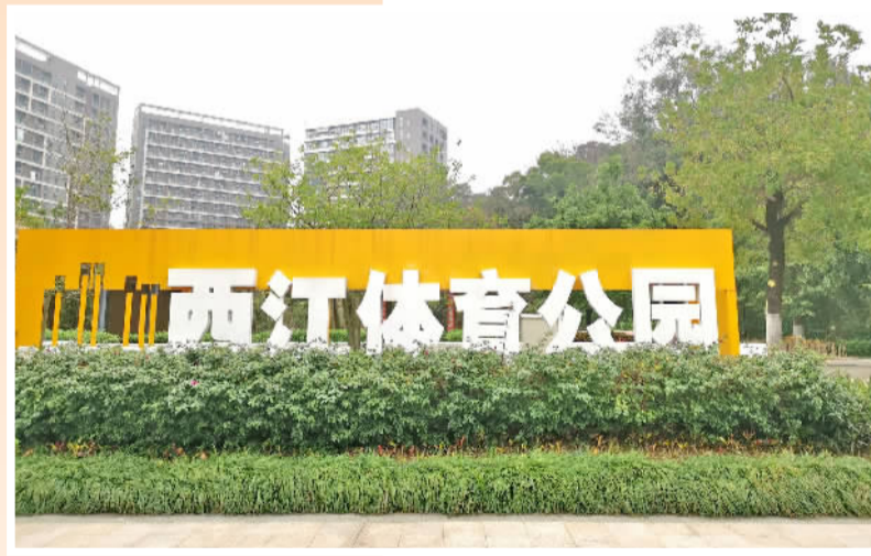
■中区社区西江体育公园。