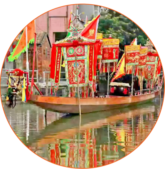
■叠滘龙船漂移竞渡远近闻名。(资料图片)

跟随记者的脚步,走进桂城农村社区,一起来听听欢聚在和美村居的家庭里,那热闹而又富有烟火味的欢声笑语,从他们的故事中感受桂城乡村之美。