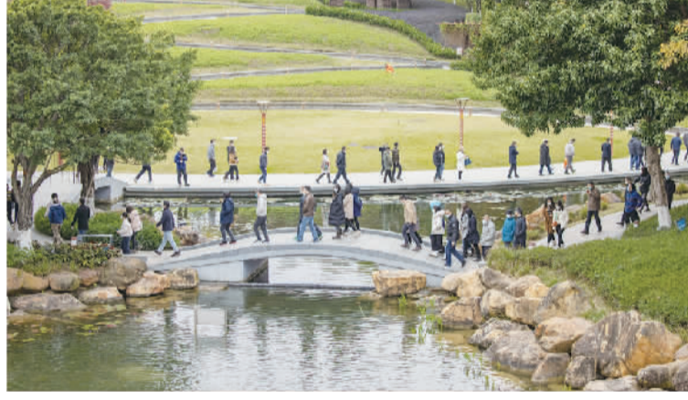
巡查团参观千灯湖公园三期水体治理项目。