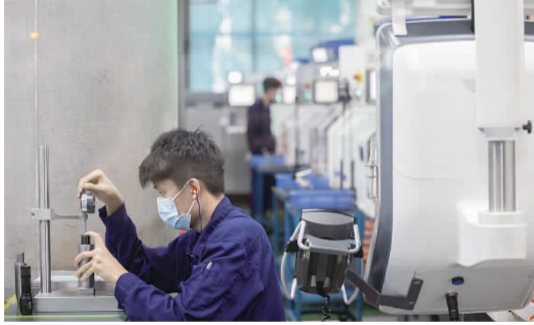
广东星联精密机械有限公司车间内,工人正在操作仪器。