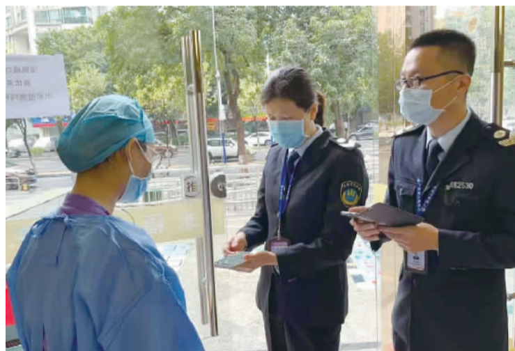
■工作人员到民营医疗机构开展专项检查。

此外,为进一步增强桂城街道各民营医疗机构及从业人员依法执业意识,规范执业行为,促进民营医疗机构提升服务能力和管理水平,保障医疗质量和医疗安全,昨日下午,桂城卫生健康办公室联合南海区卫生监督所综合监督一中队举办了医疗机构依法执业专题培训班,第一批次的50间民营内科诊所负责人参加培训,围绕依法执业、哨点监测、输液管理、以案普法等方面展开了学习。