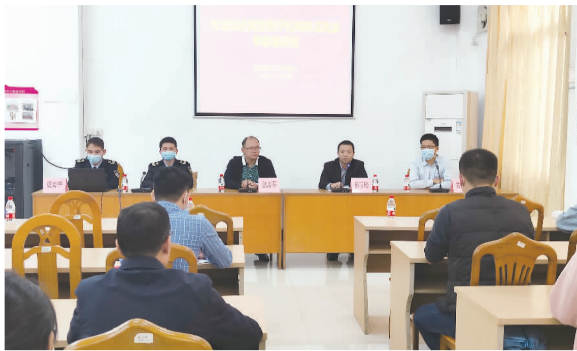
■多部门联合举办医疗机构依法执业专题培训班。

连日来,桂城卫健办专项督查小组持续开展专项行动,已对辖区60家民营医疗机构的依法执业和疫情防控工作情况进行检查,其中检查西内科诊所33间、口腔医疗机构15间、医美4间、中医诊所6间、药店2间;本次专项行动累计出动检查人员180余人次、执法车辆60辆次,责令限期整改单位18家,出具卫生监督意见书60份。