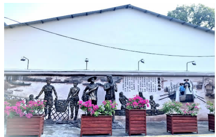
■北区渔村里充满渔业文化元素的3D墙绘和雕塑。