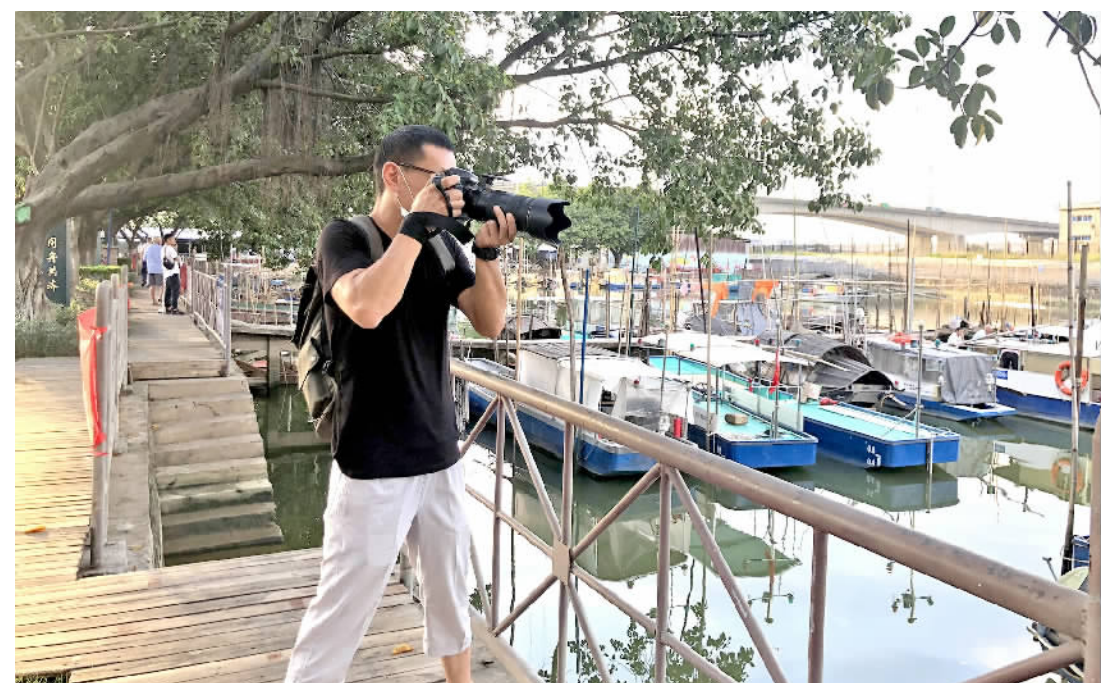
■游客在桂城凤鸣社区北区渔村拍摄打卡。

天天气清，蔚蓝色的天空、略带凉意的微风让人身心放松。在这样的好天气，“村”游再适合不过。有“南海最后一条纯渔民村落”之称的凤鸣北区渔村是桂城一道特别的风景区，这里集齐了令人向往的乡村美景和惬意生活，拍照打卡、品味美食、亲近自然、江边冥想……跟着记者这样玩，给你一个难忘的周末。