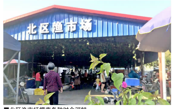
■北区渔市场售卖各种时令河鲜。