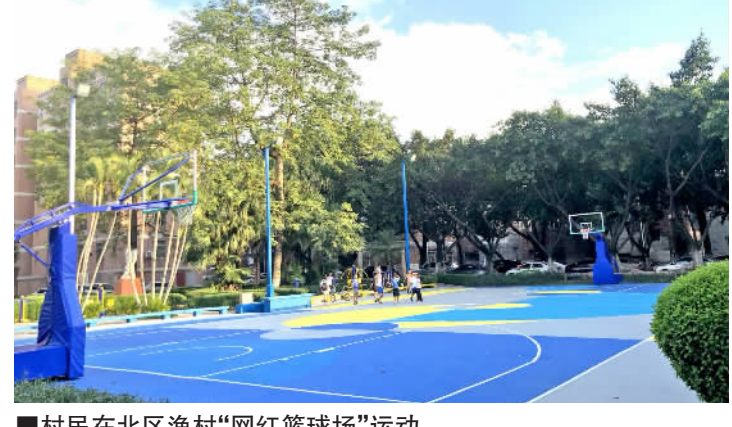
■村民在北区渔村“网红篮球场”运动。