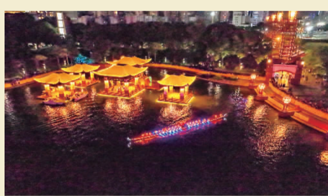
▲龙舟在湖面留下绚丽的光影轨迹。