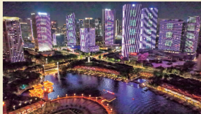
▲千灯湖夜色璀璨,灯光秀炫彩夺目。