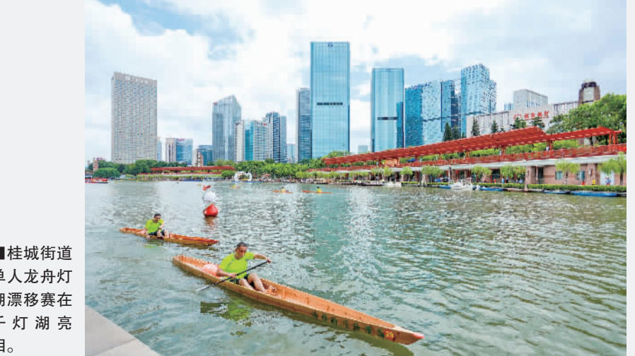
■桂城街道单人龙舟灯湖漂移赛在千灯湖亮相。