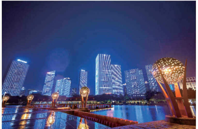
■千灯湖中央活力区璀璨夜景。

“CAZ(中央活力区),就是要产业类型多元、服务人群多元、活动时间多元。”桂城街道党工委书记岑灼雄表示,千灯湖中央活力区,未来会是最实力又美丽、最科技又文艺、最时尚又烟火、最本土又国际、最活力又集聚,十八般武艺样样精通,以美好生活引领先进生产、以生态宜居带动幸福乐业,让近者悦、远者来。