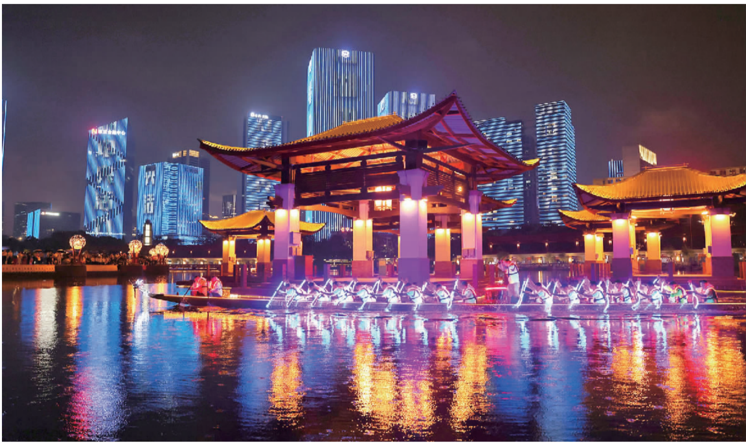
■灯湖夜光龙船漂移惊艳亮相。

其中,龙舟、醒狮将被打造成千灯湖中央公园吸引力的“流量王”,日常定时开展夜光龙船漂移及夜光醒狮演出,让市民感受岭南传统文化的魅力。此外,五大国潮主场分别是国潮户外场景、