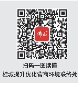
扫码一图读懂 桂城提升优化营商环境联络处