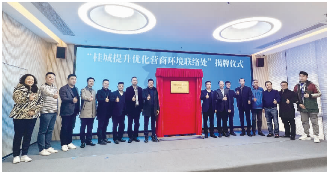
■桂城提升优化营商环境联络处揭牌成立。