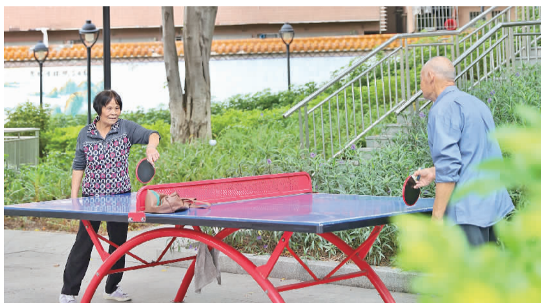
老人在东约公园打乒乓球。