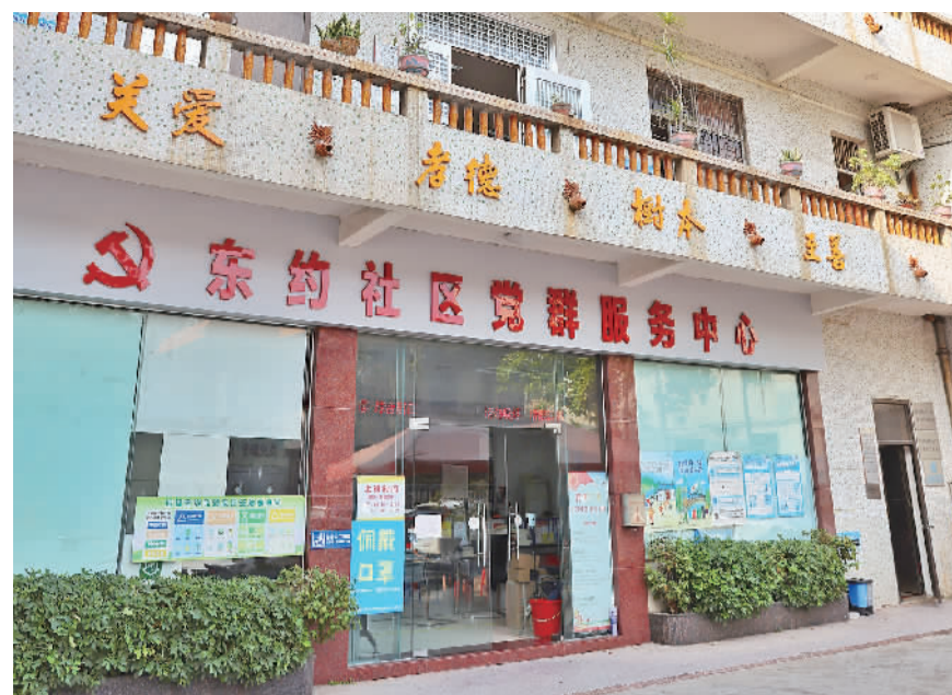
东约社区党群服务中心。