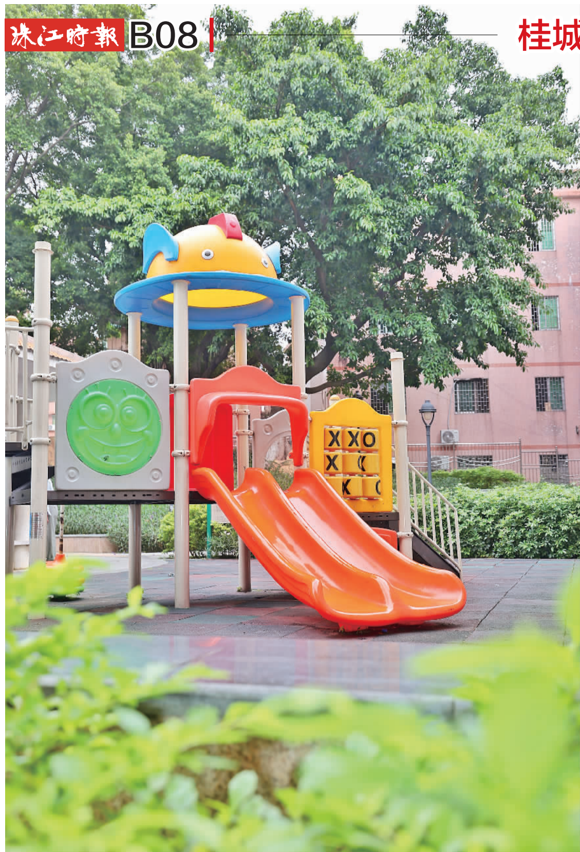
东约公园内的游乐设施。