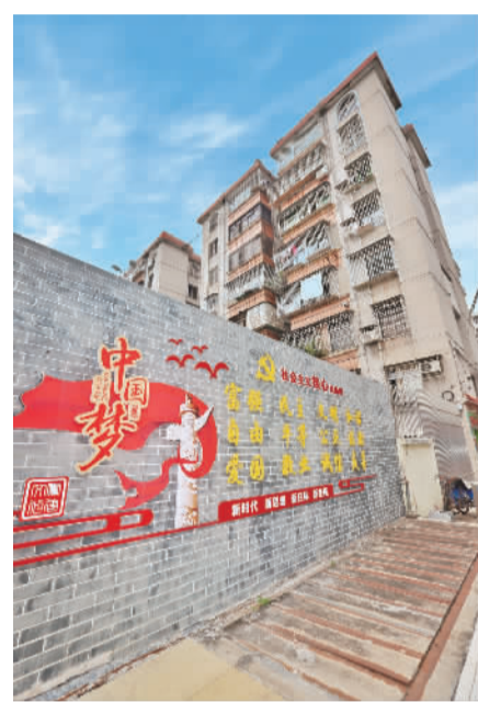
村内的党建元素墙。