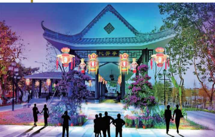
▲映月湖沁芳亭灯饰亮化效果图。