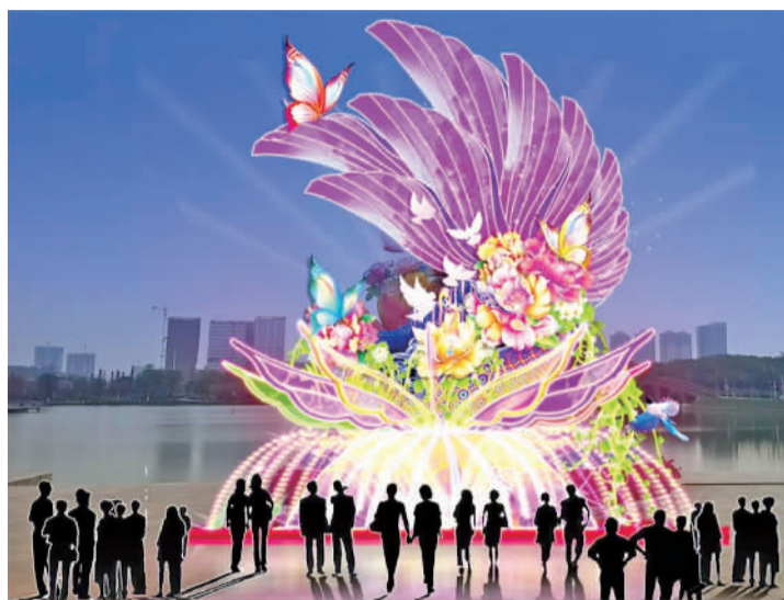
▲文翰湖中秋灯饰《韶华蝶梦》效果图。