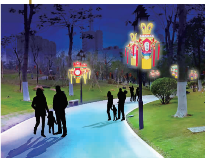
▲映月湖道路宫灯亮化效果图。