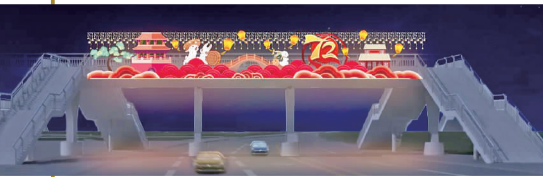
▲蟠岗公园天桥中秋灯饰《盛世华诞 祈愿安康》效果图。