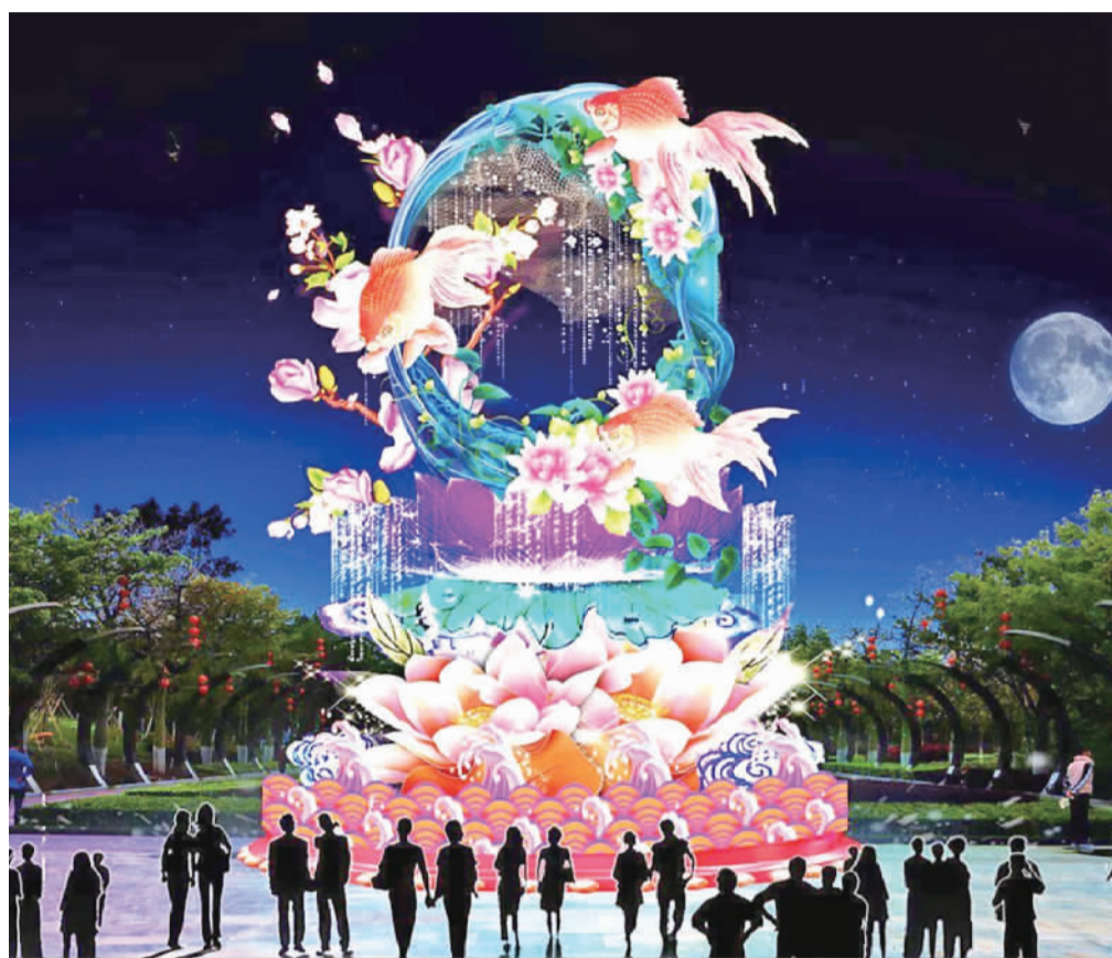
▲映月湖中秋灯饰《锦绣异彩》效果图。