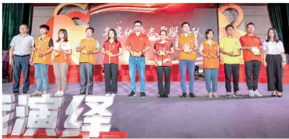
2020年度优秀志愿服务队接受表彰。