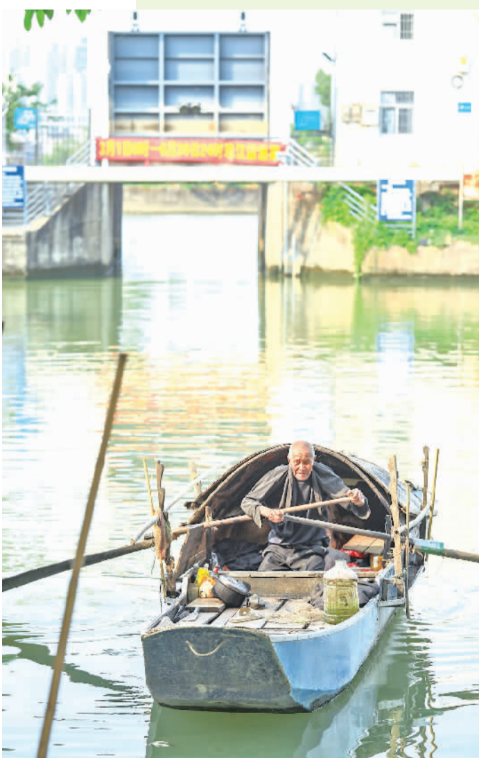
渔民在避风塘内划船而过,充满了渔村特有魅力。