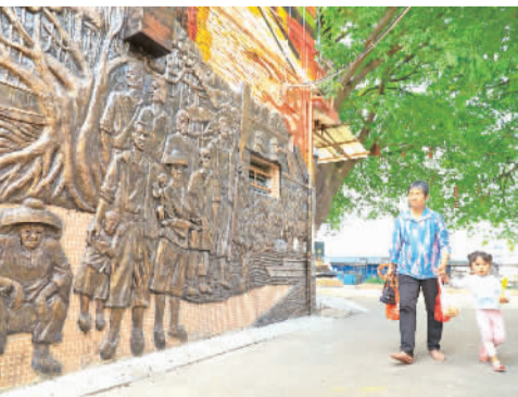
渔民渔家文化主题壁画和浮雕墙。