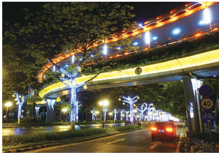
■金黄色的海三路网红人行天桥下，一排路灯像星星一样闪耀夜空。