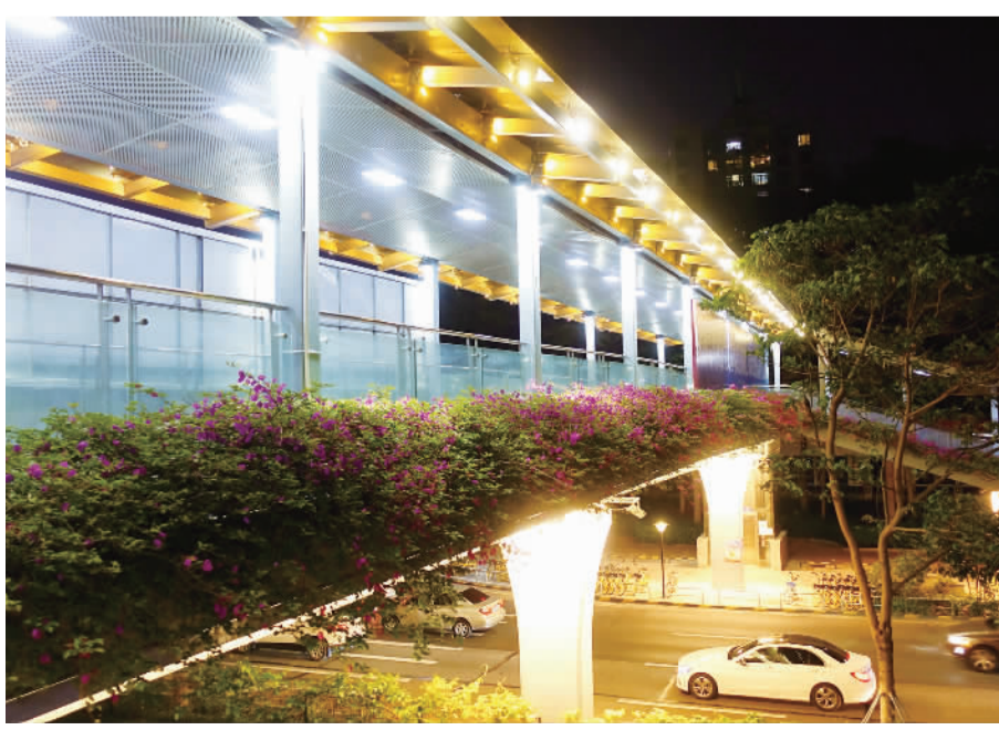
■桂平路3号人行天桥被金黄色的灯光包裹着。