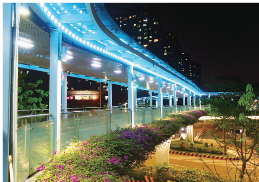
■桂平路4号人行天桥，灯饰与时花相互衬映。