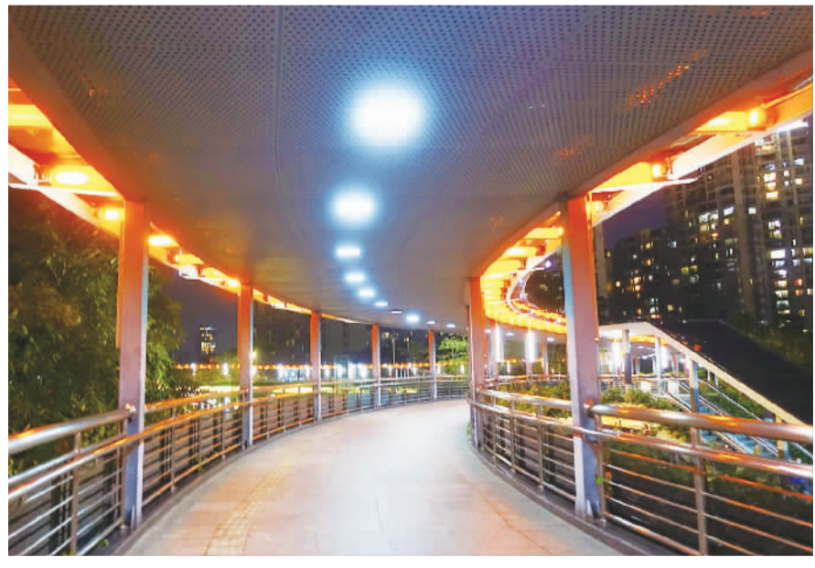
■海三路网红人行天桥犹如一条金色的光带。