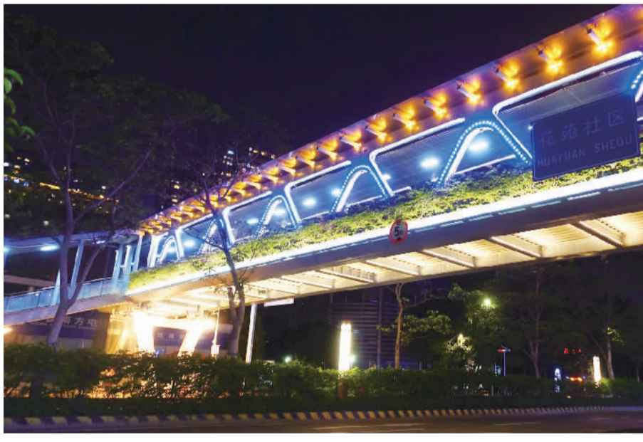
■南桂路1号人行天桥的五彩灯饰。