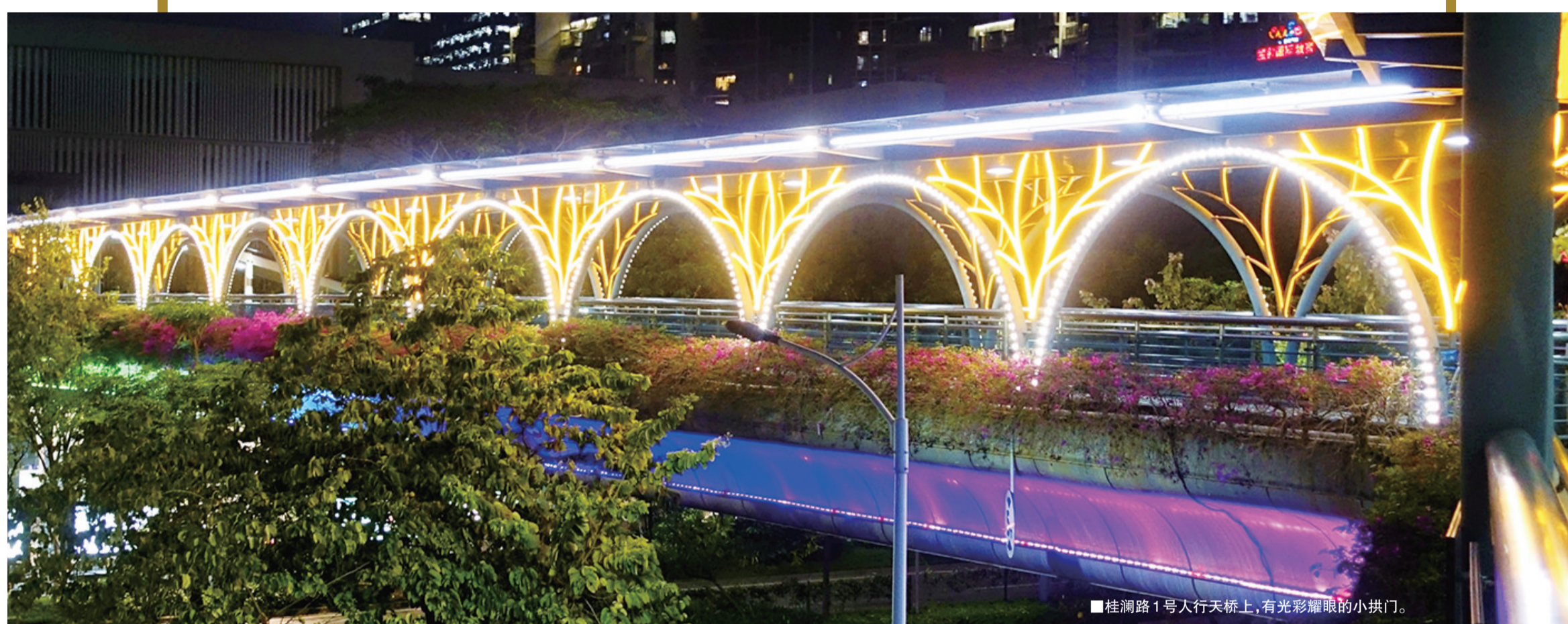
■桂澜路1号人行天桥上，有光彩耀眼的小拱门。

每天夜里，这些迷人的灯饰，不仅为市民照亮了回家的路，还营造出一片醉人的千灯景致。本期，记者带你欣赏桂城的人行天桥，一起来感受柔美醉人的夜色。 文/图 见习记者 丁当