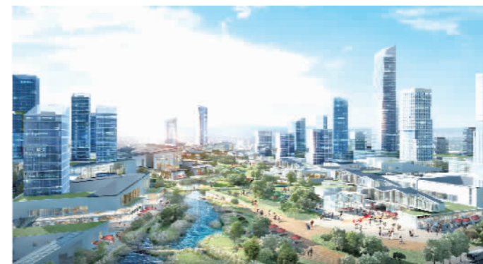
映月湖创新新城效果图。