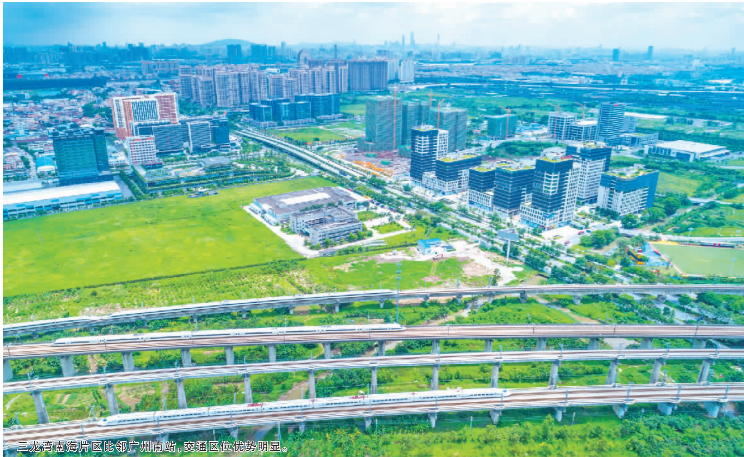
三龙湾南海片区毗邻广州南站,交通区位优势明显。

11月27日,佛山三龙湾南海片区、桂城街道联合举办“创新驱动开放引领”重点项目集中动工签约现场会,35个项目在现场签约及动工,总投资近280亿元,涵盖产业园区开发、商业开发,以及新材料、互联网、环保、医疗、芯片开发等新兴战略产业。