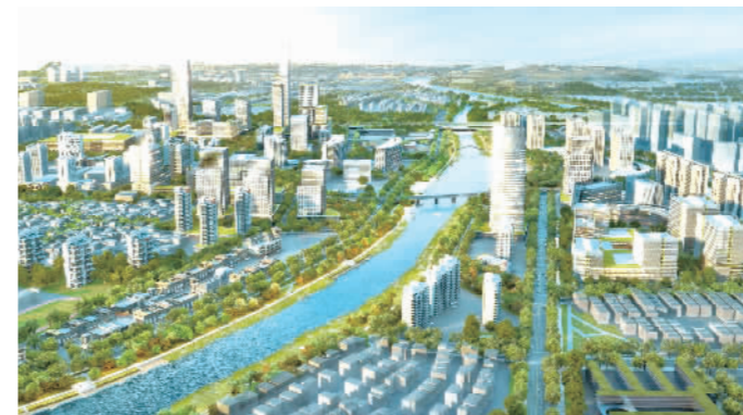
怡海湖科创产业带效果图。