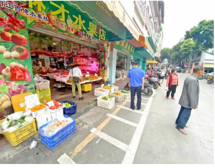
执法人员对违规户外广告、占道经营等进行整改。