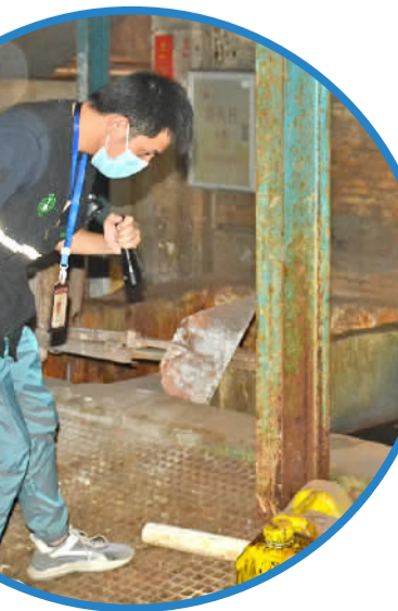
执法人员检查厂企是否存在暗管偷排现象。

当天行动共检查企业9间,发现涉嫌违法排水企业1间,出具整改帮扶意见书6份。“利剑”行动期间,丹灶镇生态环境监管所按照上级要求,开展错时专项执法、节假日专项执法、夜间执法等行动,清理查处一批涉水违法企业,保质保量完成水环境质量整治攻坚任务。