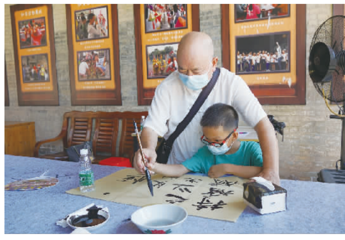
■书法家手把手教小朋友写书法。

接下来,丹灶镇各级妇联将陆续开展“安安哨子”儿童安全教育普及、有为家庭教育课程、夏令营等活动,让全镇青少年儿童享受缤纷有趣的暑假时光,进一步深化儿童友好型社区建设,形成全社会关心保护少年儿童、服务少年儿童的良好氛围。