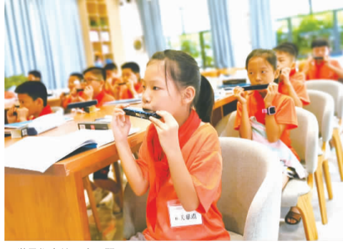
■学员们在练习吹口琴。

南海区总工会副主席金勇刚表示,本次公益夏令营是南海区总工会今年群团组织工作的新创新,接下来,南海区总工会将继续做好职工贴心“娘家人”,把“感受南海,快乐成长”主题打造成群团服务工作的一个新品牌,一面新旗帜。