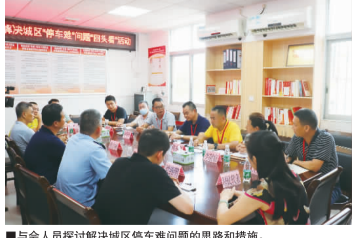
■与会人员探讨解决城区停车难问题的思路和措施。

珠江时报讯(见习记者/蓝景熙 通讯员/徐秋燕 徐成雄 摄影报道)日前,丹灶镇人大开展解决城区停车难问题“回头看”调研活动,组织中心联络站、金宁社区联络站驻站代表、居民代表和相关单位负责人实地视察新增的公共停车场,并在中心联络站召开座谈会,了解镇政府解决停车难问题的相关举措和成效,进一步探讨解决城区停车难问题的思路和措施。