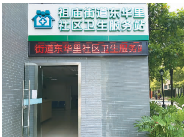
东华里社区卫生服务站位于东华嘉苑二期东瑞路5号10座首层。