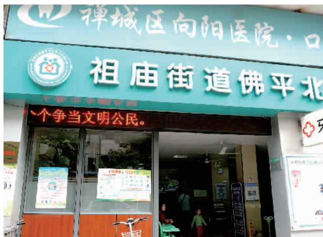
佛平北社区卫生服务站位于禅城区文庆路17号一座。