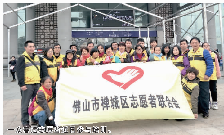
一众春运志愿者近日参与培训。

者,今年也不例外。他在培训会中表示,通过春运志愿者服务技能培训,除了能让志愿者更好地为市民服务,也可以宣扬志愿者服务精神。希望能带动更多市民参与进来。