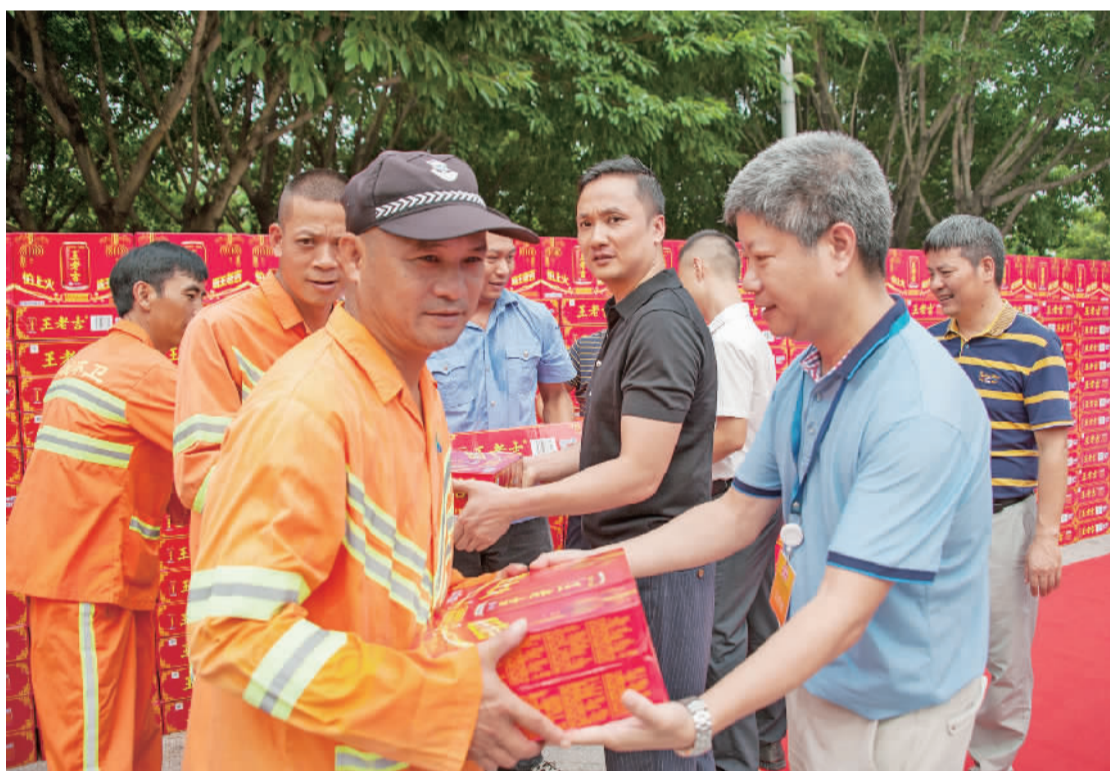
禅城一爱心企业向环卫工人赠送凉茶。

为给市民营造干净的城市环境,广大环卫工人在高温下依旧坚守岗位,顶烈日、斗酷暑,禅城区环境卫生养护中心相关负责人倡议,希望有更多的爱心企业、商家为环卫工人提供歇脚场所,供应饮水。同时也呼吁市民,切勿随手丢弃垃圾,减轻环卫工人的劳动强度。