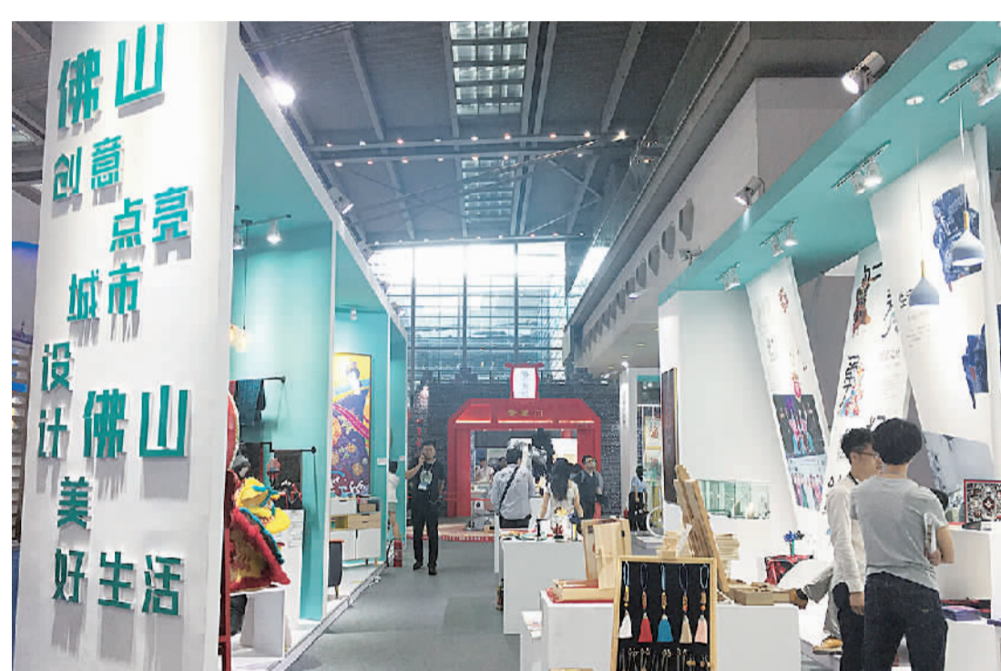
■佛山展馆以“梦想魔盒”为设计概念,别具时尚特色。

时还采用红外感应触摸系统,实现所有文创园区以地图视频形式呈现,并实现现场观众触控交互互动功能。