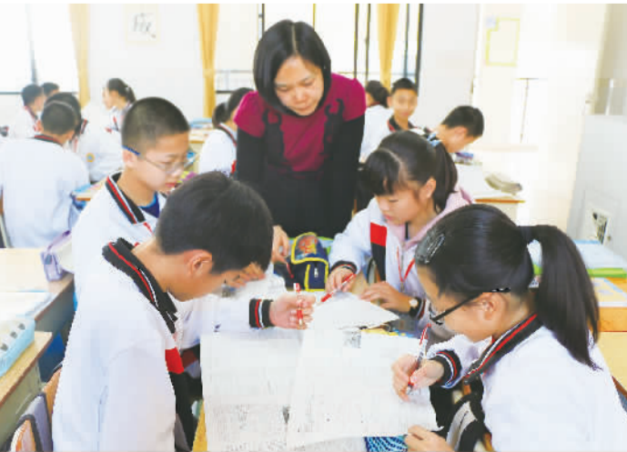
教师指导学生开展课堂探究。