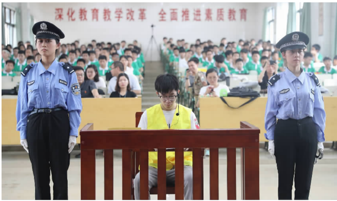
模拟法庭正在进行模拟审判。

在法制进校园活动的尾声，禅城法院少年审判庭庭长黄庆孝向同学们强调了毒品的危害，告诫同学们一定要远离毒品。同时，也建议同学们谨慎交友，与社会上的青年打交道时更是要多加小心，切勿为了所谓的“讲义气”