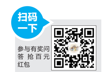
参与有奖问答抢百元红包

主办方介绍,市民需先扫一扫,识别禅城食安二维码,进入公众号,然后点击下面的有奖问答栏目,进入游戏界面。活动一共有7道题目,需要答对全部题目才能进行抽奖,获奖后需填写相关信息。每个用户每天有2次抽奖机会。另外,把活动链接分享给微信好友或朋友圈,可增加1次抽奖机会(增加次数每日仅限1次)。此外,禅城食安微信还推送了答题提示,在科普食品安全知识的同时提高答题准确率,市民参与活动前可认真阅读。