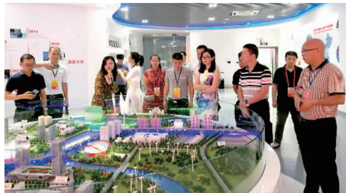
调研组实地参观了位于华南电源创新科技园的航天柏克(广东)科技有限公司。