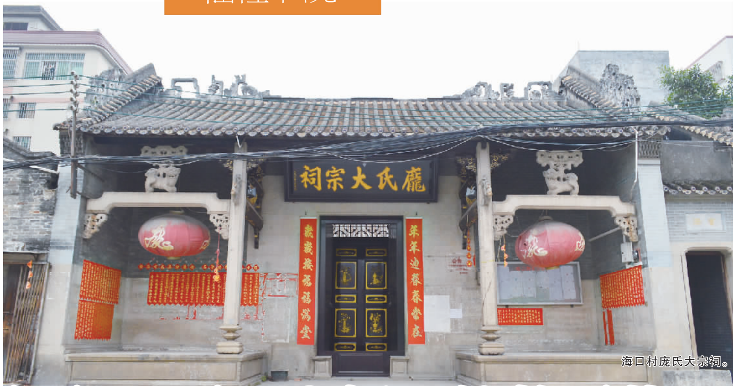
海口村庞氏大宗祠。

上一期仙槎书院我们介绍了弼唐村的祠堂，这一期我们走进海口村，介绍一下海口村的历史和该村的庞氏大宗祠和其他几个还保存尚好的宗祠。庞氏大宗祠是佛山市文物保护单位，这座建于清代的祠堂，见证了整个海口村的历史变迁，也维系着庞氏族人的寻根问祖的血脉，历经修整，在今天依然是海口庞氏族人的“信仰”。