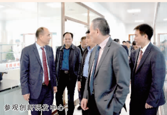
参观创新研发中心。